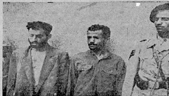
ראשי הממשלה החדשה, מנחם בגין, יחד עם חברי הממשלה החדשה, בחדר המועצה להגנה וביטחון הממשלה ב-15 במרץ 1977.

אחד מראשי הממשלה החדשה, מנחם בגין, בחדר המועצה להגנה וביטחון הממשלה ב-15 במרץ 1977.