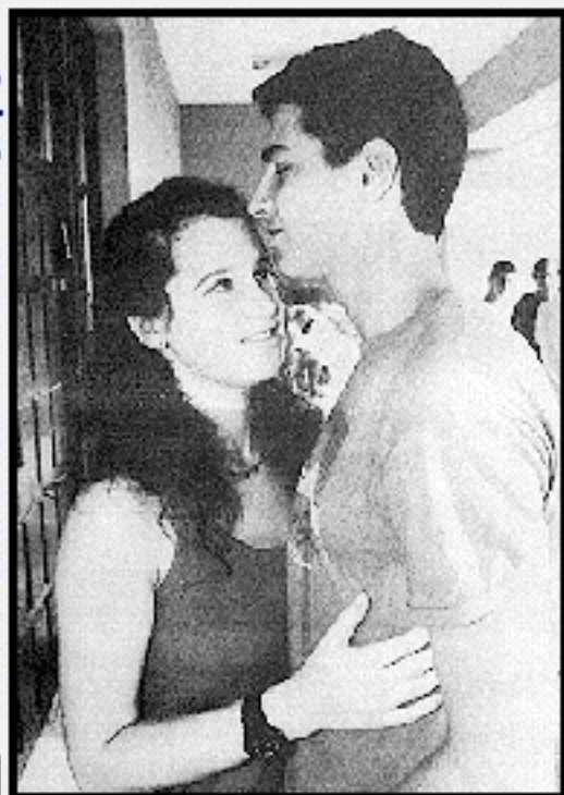
ערוץ עופר נפרד מהחברה לפני הגיוס

רק שני קילומטרים, בערך, מפרידים בין שכונת הפועלים בעפולה לבית הקברות העירוני. פקקי התנועה הרגילים יגזלו מהנהג הממוצע כשמונה דקות נסיעה, בשעות השיא בתנועה. כיום שישי האחרון, בשעות הצהריים שאחרי סגירת החנויות ולחץ התנועה של סוף השבוע, זה לקח כמעט שעה. שוב צהריים של יום שישי. במעם השנייה בחודש אחד ארוך, מלווה כל העיר בן בררבו האחרונה. כיום המישי לפנות ערב, בערך בזמן שבעפולה נשבר השרב, הסתיימו בבית החולים "יוספטל" באילת אירועי הטראגדיה של אותם שלושה ימי חום תופת. יחידה טובחרת של צה"ל איברה שני לוחמים בקטע של מסע ניווטים. שני בחורים, שטובים מהם אולי יש, גורעים מהם בסוח שישי, אבל אין טובים כמותם.