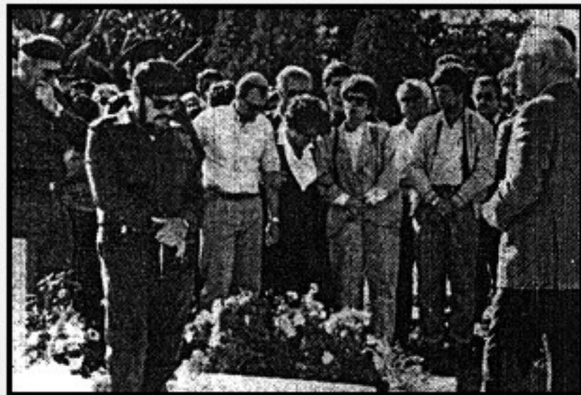
אזכרה לגדעון מחניימי אתמול

ראש העיר העלה בדבריו זכרונות משנות ילדותו, כשהוא מדגיש את כשרונו להתהלך כשווה בין שווים עם בעלי שררה ופשוטי העם. הוא עמד על אהבתו הגדולה לארץ; הזכיר את טיוליו, שבהם ביקש לראות גרקיטים הנפתחים עם בוקר, עם תום הטכס, לא מיהרו הבאים להתפזר. כל אחד דומה, ביקש עוד רגע, כדי להיות עם גדעון כפי שזכר אותו.