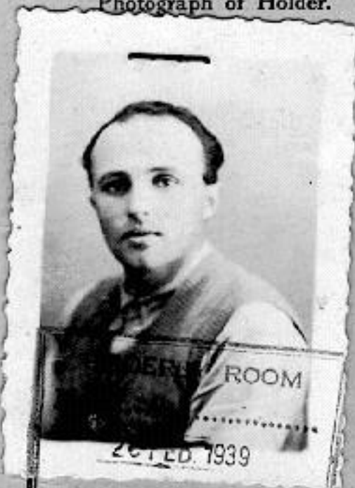
Photograph of Holder.

Signature of Holder 1st. Bn. THE HAMPSHIRE REGT