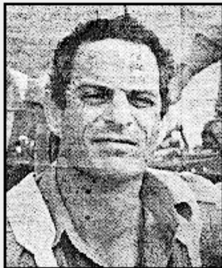
רבי־סרון חנון סמסון הילדות באו לבקר