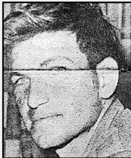
רבי־סרון יוסי קפלן אסון רוף אסון