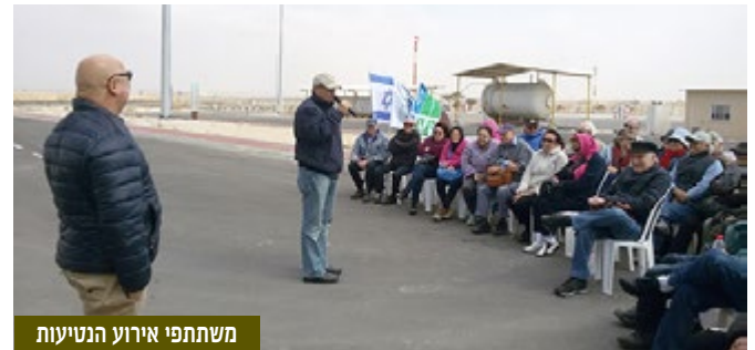
משתתפי אירוע הנטיעות

■ נוטעים ב"יער אגמון" - גמלאי אגמון שהגיעו לגבורות נטעו ב-21 בפברואר 2016 עצים ב"יער אגמון" הנמצא בצמוד לכפר הנוער בניצנה. הפרויקט של נטיעת