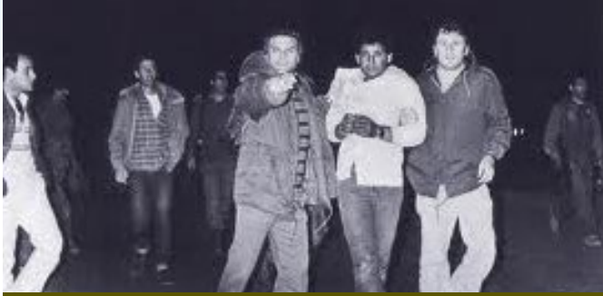
אנשי השב"כ אוזרים באחד המחבלים שביצעו את הפיגוע בקו 300