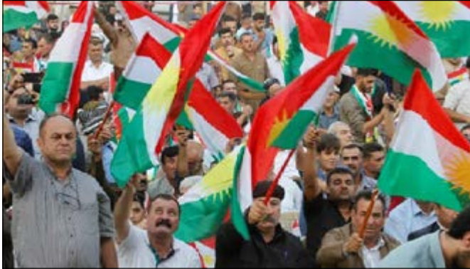
עצרת תמיכה במשאל העם לעצמאות הכורדים

החוקה. הממשלה הכורדית הציעה עוד "הפסקת אש מיידית והפסקה של כל הפעולות הצבאיות בכורדיסטאן". זאת, לאחר שכ-30 לוחמי "פשמרגה", חברי ממשלה וחברי פרלמנט כורדים נהרגו בפעולות, אשר בוצעו ע"י כוחות הביטחון העיראקיים ואשר מטרתן הייתה "החזרת הכוח לשלטון המרכזי" באזורים שבמחלוקת, לרבות בכרוכ. הבחירות לפרלמנט: ב-12 במאי 2018 היו בעלות חשיבות מכרעת לראש הממשלה ולארה"ב התומכת בו. למרות שאל-עבאדי עשה לייצב את הביטחון ופעל לשקם המצוקה הכלכלית (לפי נתוני האו"ם כ-2.6