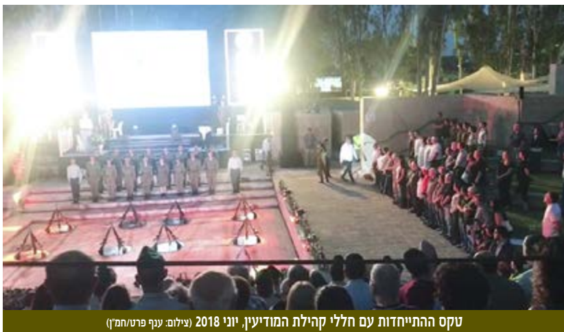
טקס ההתייחדות עם חללי קהילת המודיעין, יוני 2018