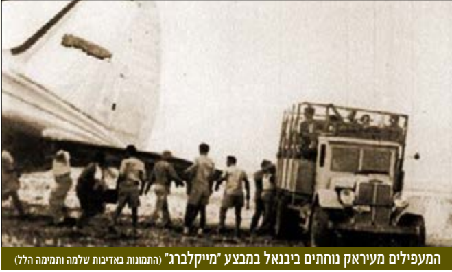
המעפילים מעיראק נוחתים ביבנאל במבצע "מייקלברג"