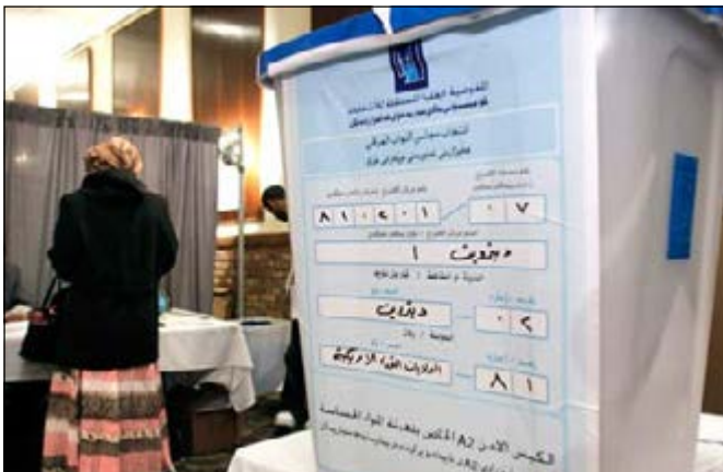
הבחירות בעיראק

החוקה. הממשלה הכורדית הציעה עוד "הפסקת אש מיידית והפסקה של כל הפעולות הצבאיות בכורדיסטאן". זאת, לאחר שכ-30 לוחמי "פשמרגה", חברי ממשלה וחברי פרלמנט כורדים נהרגו בפעולות, אשר בוצעו ע"י כוחות הביטחון העיראקיים ואשר מטרתן הייתה "החזרת הכוח לשלטון המרכזי" באזורים שבמחלוקת, לרבות בכרוכ. הבחירות לפרלמנט: ב-12 במאי 2018 היו בעלות חשיבות מכרעת לראש הממשלה ולארה"ב התומכת בו. למרות שאל-עבאדי עשה לייצב את הביטחון ופעל לשקם המצוקה הכלכלית (לפי נתוני האו"ם כ-2.6