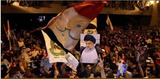
תומכי מוקתדא צאדר חונגים את תוצאות הבחירות שנערכו במאי 2018

נידחות אך ללא יכולת שליטה בשטח. גרשון הכהן ציין כי "הרעיון" של דאע"ש ספג מכה אנושה אותה יתקשה להסביר, שכן במקרה זה ההרס והחורבן לא הביאו לגאולה. דאע"ש הפועל באזורים בצפון מערב עיראק והמצוי בתוך האוכלוסייה, ימשיך לפעול בשטח עיראק ויערער את היציבות.