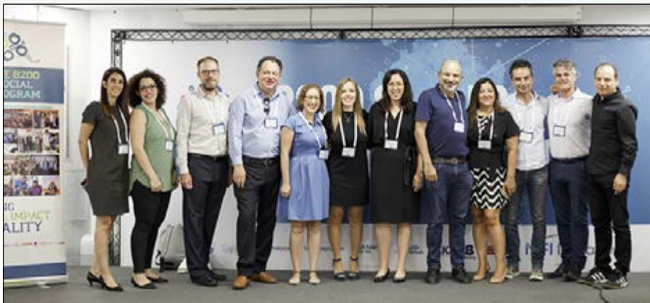
נציגי הגופים השותפים ל"תוכנית החברתית": כיל, נשיץ-ברנדס-אמיר, אמדוקס, KPMG, נפש בנפש, בנק הפועלים, עיריית תל-אביב-יפו, "בזק", MFI Initiative והפדרציה היהודית של ניו-יורק