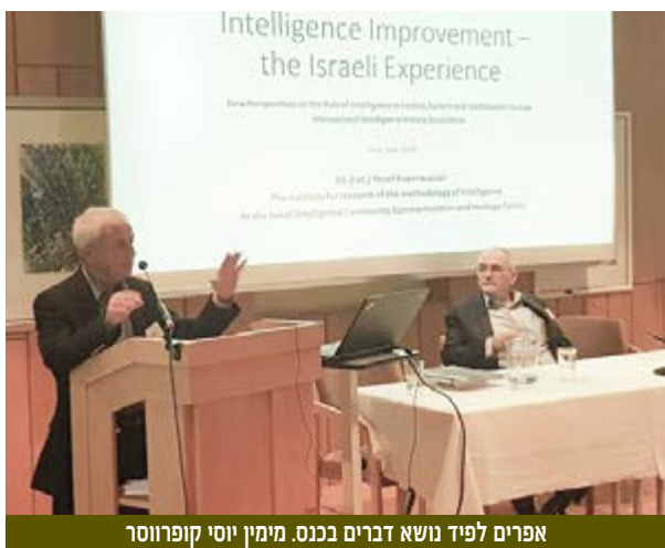
אפרים לפיד נושא דברים בכנס. מימין יוסי קופרוסר

מנהל המכון לחקר המתודולוגיה במל"מ תא"ל (מיל) יוסי קופרוסר ותא"ל (מיל) ד"ר אפרים לפיד השתתפו לאחרונה בכנס בינלאומי של היסטוריונים של מודיעין בגראץ, אוסטריה. קופרוסר הציג את תהליך לימוד הלקחים במודיעין הישראלי ולפיד הציג את הקשר המודיעיני המשולש בשנות ה-60 וה-70: איראן, תורכיה וישראל.