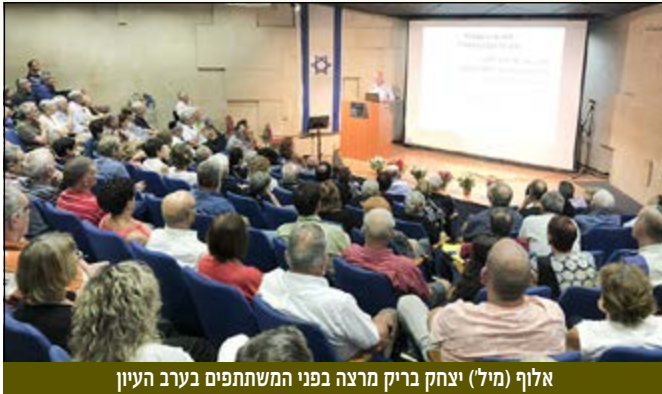
אלוף (מיל) יצחק בריק מרצה בפני המשתתפים בערב העיון

את ערב העיון חתם האלוף (מיל) יצחק בריק, שריונר בעל עיטור העוז, שדיבר בלהט סוחף על "מנהיגות וגבורה במצבי קיצון", וריתק את הקהל בסיפורו האישי ממלחמת יום הכיפורים. בריק היה טנקיסט מילואימניק בגדוד 113 של אסף יגורי, חטיבה 217, האוגדה של ברן. עם פרוץ המלחמה יצא בטנק אחד בליווי טנק נוסף וזחל"מ אחד - לתוך סיני, קרוב לתעלה, מרחק של 230 ק"מ! נלחם 19 ימים עקובים מדם, כשחבריו סביבו נפצעו ונהרגו, כשהוא עצמו נפצע פעמיים, מסרב להתפנות, עובר מצבים בלתי אפשריים, כולל מארב מצרי של 120 לוחמי קומנדו ולחימת פנים אל פנים, עד כיתור העיר סואץ והכרעת הצבא המצרי. לדעת האלוף בריק, מי שהביא לנו את הניצחון במלחמת יום הכיפורים היו החיילים והמפקדים הזוטרים בשטח. הוא הדגיש את אחריות המפקד, הצורך שלו לנטרל רעשים חיצוניים ולהיות ממוקד בחייליו ובמשימותיו; לקבל החלטות בשדה הקרב ולהוביל את חייליו לניצחון עם כמה שפחות אבדות. האלוף בריק העלה על נס את רוח צה"ל, שבזכותה הושג הניצחון - את הדוגמה האישית, האמינות והנחישות, הלכידות, הערבות ההדדית, אחוות הלוחמים, הרעות!