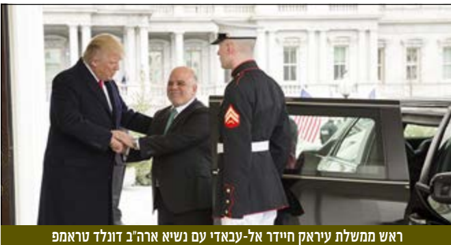
ראש ממשלת עיראק חיידר אל-עבאדי עם נשיא ארה"ב דונלד טראמפ

הקמת "החליפות האסלאמית" על ידי דאע"ש בשטחים שבמערב עיראק, בצפון מערבה ובמזרח סוריה, החלה ב-2016 מערכה לסילוק ולביסוס מחדש של השליטה של הממשלה המרכזית בבגדאד. בלחימה הקרקעית נטלו חלק כוחות צבא עיראק, הכורדים ("פשמרגה"), מיליציות שיעיות מזויינות, אשר בחלקן מומנו, חומשו ואומנו ע"י איראן, וקבוצות סוניות חמושות, לעיתים תוך שיתוף פעולה המשך בעמוד 4