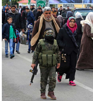
ילדים פלסטינים בעזה

חמאס הטמיע בקרב הדור הצעיר את ערך הג'האד, ההקרבה, הזיכרון הקולקטיבי של הנכבה, והפכה את