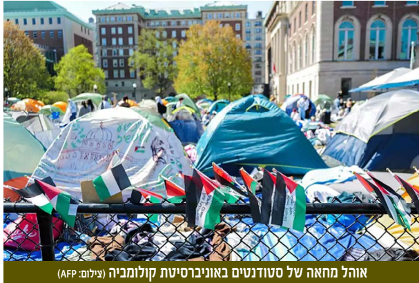
אוהל מחאה של סטודנטים באוניברסיטת קולומביה

אנטישמיות חמורה. הקשר בין מימון זר לאוניברסיטאות ממדינות אוטוקרטיות לשחיקת ערכים ליברליים ועליית האנטישמיות גם הוא נדון. הוזכר שמוסדות כמו הארווארד קיבלו סכומי עתק ממקורות תקציב לא מדווחים, המשפיעים על בחירת המרצים והתכנים הנלמדים.