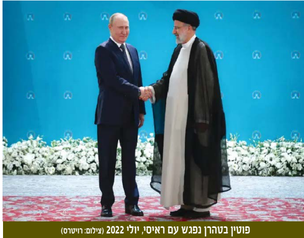
פוטין בטהרן נפגש עם ראסי, יולי 2022

מדיניות החוץ של רוסיה מבקשת להתקרב למדינות הדרום הגלובלי (שחלק ניכר מהן מוסלמיות) ולהאשים את ארה"ב ובפרט את ממשל ביידן באחריות ליצירת תנאים למשבר במזה"ת באמצעות גיבוי ישראל והנצחת נחיתות הפלסטינים. רוסיה