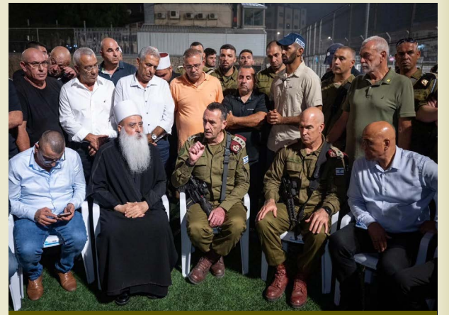
הרמטכ"ל בביקור במגדל שמש אחרי הטבח