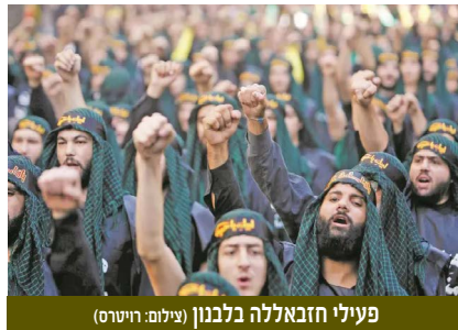
פעילי חיזבאללה בלבנון

העיתוי של מתקפת ה-7 באוקטובר הפתיע את חיזבאללה. למרות שהיה שותף לגיבוש התפיסה של החמאס בדבר מהלך משותף של "ציר הרשע" שיביא לחיסולה של ישראל. אלא שחיזבאללה וגם