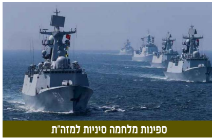
ספינות מלחמה סיניות למה"ת

נטייה פרו-פלסטינית שהובילה לשיח ציבורי ביקורתי נגד ישראל ואף להתבטאויות אנטישמיות ברשתות החברתיות בסין. כיוון שהתקשורת הסינית היא תחת פיקוח הדוק של השלטון, ניתן לראות בזה מעין הסכמה שבשתיקה. דינמיקה זו נובעת מהצורך של סין לשמור על תדמית כמעצמה חזקה ששומרת על האינטרסים הכלכליים והבריתות האזוריות שלה,