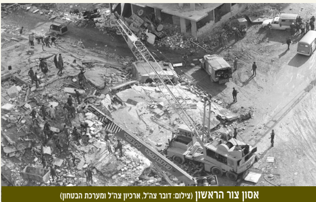
אסון צור הראשון