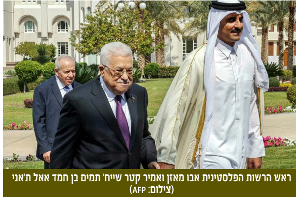
ראש הרשות הפלסטינית אבו מאזן ואמיר קטר שיחי' תמים בן חמד אאל ת'אני

בבחירות הפנימיות למוסדות החמאס (מרץ 2021) הועמד מולו נזאר עוודאללה, מקורבו של משעל שניצח אותו. אך בשל התנגדות גדודי אל-קסאם, סינוואר הושאר בתפקיד. בתום המערכה הצבאית בין ישראל והג'האד האסלאמי (2022), שסינוואר החליט לא להשתתף בה, התפרסמה קריקטורה בכלי תקשורת קטרי "אל-ערבי אל-ג'דיד" שהציגה את סינוואר כמי שעמד בשורה אחת עם אבו-מאזן, שיתף פעולה עם ישראל ובגד בעם הפלסטיני.