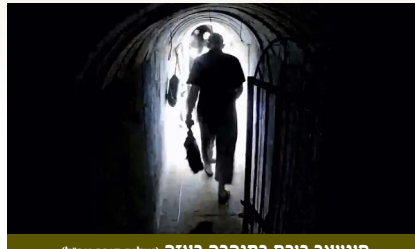
סינוואר בורח במנהרה בעזה

הנייה וצאלח אל-עארורי - עומדת בפניו הברירה להשתמש ב"קידום" שקיבל כדי לסגור עסקה לשחרור חטופים תמורת אסירים פלסטינים. זו תירשם על שמו ולא על שם של משעל ואמיר קטר - ואולי גם תשמר את יכולתו להשפיע על "היום שאחרי" באמצעות מוחמד דחלאן מצד אחד, ושחרור מרוואן ברגותי, מנהיג 'פתיח' הזוכה