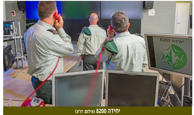
יחידה 8200