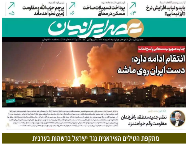
מתקפת הטילים האיראנית נגד ישראל ברשתות בערבית

הסתמכות היתר על מקורות טכנולוגיים מתקדמים, כפי שנחשפה במיוחד באוקטובר 2023, מחייבת בנייה של מודל חדש של איסוף מידע וניתוחו. כזה שיאפשר ניצול מאוזן יותר של מקורות אנושיים מפותחים, ומקורות טכנולוגיים מתקדמים עם נוכחות אנושית. אמ"ן, שב"כ והמוסד נדרשים לפתח שיטות עבודה שמשלבות בין המידע המגיע מהשטח לבין מיצוי המידע המצטבר בכלים טכנולוגיים. כך ניתן יהיה ליצור מערכת שתשלב את היתרונות של הטכנולוגיה המתקדמת עם העומק, ההבנה והעושר שרק נוכחות בשטח יכולה להציע. במקביל יש להעשיר את יכולות הניתוח תוך דגש על חשיבה ביקורתית, עשירה, מולטי-דיסציפלינרית, והדגשת ערכים של מקצוענות ויושרה. צריך לאפשר תרבות של שיח והצגת מגוון דעות, הערכות סותרות ואיפכא מסתברא כולל מול מקבלי ההחלטות בזמן אמת. כיו"ר המרכז למורשת המודיעין יש לזכור כי מטרתנו היא לחנך לערכים ולאורם ללמוד לקחים, ללמוד את העבר בראייה לעתיד. מורשת המודיעין צריכה לחנך לחשיבה עצמית, לחשיבה ביקורתית, לראייה כוללת, לדבוק באמת גם אם אינה פופולרית, להתעקש על התעמקות, ללמוד וללמוד מהלקחים, ולבסוף להפגין אומץ ותעוזה. איש מודיעין נדרש להציג את עמדתו בפני הקברניטים גם אם היא חריגה, ובמקרה הצורך למשוך בדש מעלים.