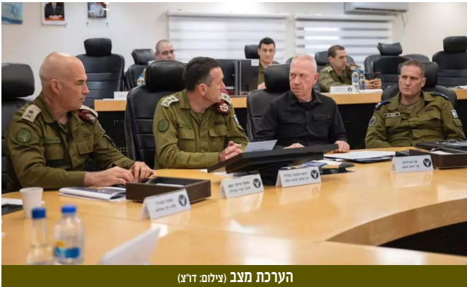
הערכת מצב

המודיעין חייב להיערך מחדש ולתת מענה להתמודדות עם שלושה אתגרים: המשך המערכה מול החזבאללה, האתגר הפלסטיני, והתמודדות מול איראן - האפשרות לתפוצת נשק גרעיני במזה"ת. המודיעין נדרש לפעול לשיקום אמון הציבור ע"י השלמת התחקירים והצגתם לציבור