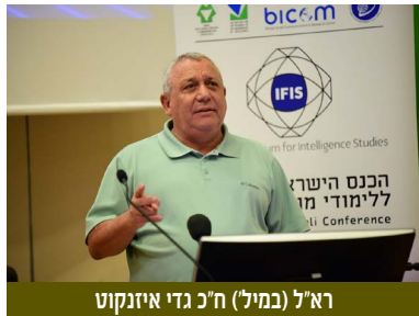
רא"ל (במיל) ח"כ גדי איזנקוט