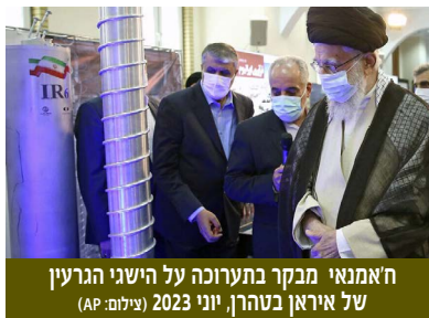
ח'אמנאי מבקר בתערוכה על הישגי הגרעין של איראן בטהרן, יוני 2023

איראן מהווה איום אסטרטגי ראשון במעלה לישראל. בשונה מהעבר מתמודדת ישראל עם אויב העולה עליה לא רק במשאביו כמו בעבר, אלא משתווה אליה ברמתו הטכנולוגית ואולי אף מתוחכם ממנה בחשיבה אסטרטגית. האיבה לישראל מהווה מרכיב מרכזי באידיאולוגיה של המשטר, ומשרתת את האינטרסים שלו. האיתוללה רוחאללה ח'ומיני, המייסד והאידיאולוג של הרפובליקה האסלאמית ראה בציונות את המפגש בין מאבק היהודים באסלאם מימי הנביא מוחמד, לבין המתקפה המשולבת של המערב והיהודים נגד האסלאם בעת החדשה. נוסף לכך, ח'ומיני ראה בציונות פשע נגד העם המוסלמי של פלסטין, והציג את חיסולה כמצווה דתית.