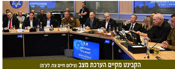
הקבינט מקיים הערכת מצב

ההזדמנות לפעול לעיצוב מציאות ביטחונית חדשה בלבנון, שתאפשר את החזרת עשרות אלפי התושבים לבתיהם. זו צריכה להתבסס על שני נדבכים מרכזיים. האחד, המשך ההחלשה והפירוק של היכולות הצבאיות של חזבאללה.