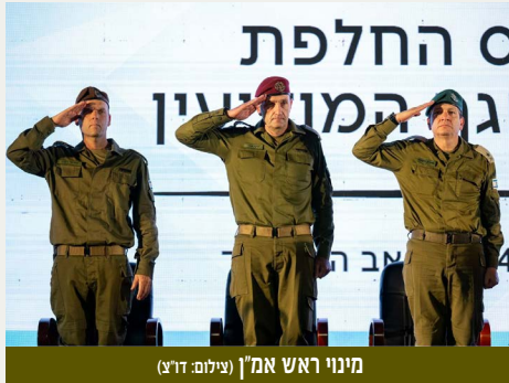
מינוי ראש אמ"ן

להשתנות. לדעת להיות נועזים לשאול וגם להקשיב. לאפשר לכל אחת ואחד להביע דעה ולשקול אותה בכבוד ראש. לעשות את כל אלו כדי לעמוד במבחן העליון שלנו - מתן התרעה למלחמה ומודיעין שיאפשר לנו עמידה במטרותיה". המרכז למורשת המודיעין מאחל לראש אמ"ן החדש הצלחה עם כניסתו לתפקיד. הצלחתו הצלחתנו".