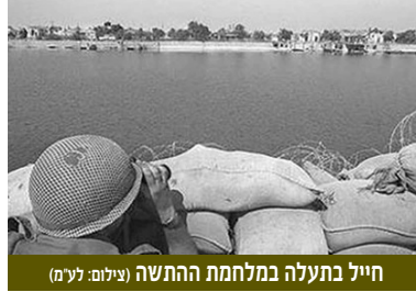
חייל בתעלה במלחמת ההתשה

מלבד נושאי ההתרעה הרי שהיעיסוק המרכזי במודיעין היה השתלבות בהגנת הקווים אך ובעיקר באיתור יעדים בהכנת מודיעין למבצעים ובשותפות מלאה בעשרות מבצעים מיוחדים בעיקר בחזית מצרים מערבית לתעלה ולמפרץ סואץ. מאמצים ניכרים הושקעו בלחימה אל מול החזית המזרחית, ומבצעים מיוחדים בוצעו גם כאן בקווי המגע ועומק. גם משפסקה הלחימה בגזרה העיקרית לביל ה-7-8 באוגוסט 1970 היא נמשכה בגזרות האחרונות עד למבצע הקצצר "קצין חי"ר ראשי" והמוסד "אביב נעורים" ממש ערב מלחמת יום הכיפורים.