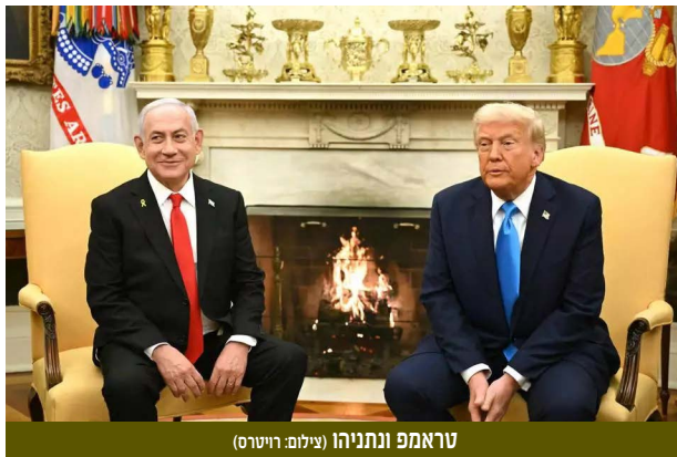
טראמפ ונתניהו

פוטנציאל לפערים בשורת נושאים מרכזיים, בפרט המדיניות מול איראן, המלחמה ברצועת עזה והסוגייה הפלסטינית.