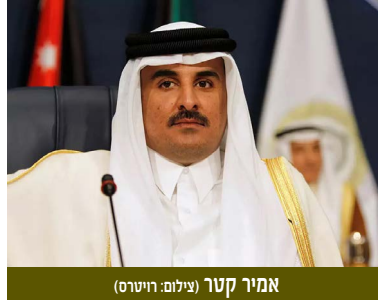
אמיר קטר

ספקי הנשק המרכזיים של הנסיכות, הקטרים מבצעים רכישות אסטרטגיות בנכסים בארה"ב ובמערב בהשקעות חסרות תקדים, מארחים אירועי ספורט ותרבות מרכזיים, רוכשים בתי אופנה מרכזיים בעולם, ובעיקר משמשים מתווכים מרכזיים בין המערב לארגוני טרור אסלאמיים ברחבי העולם ולמשטרים עריצים כדוגמת הטאליבן.