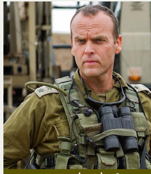
ראש אמ"ן אלוף שלומי בינדר

הארגונית במסגרת תהליך התיקון. רמ"ח מוד"ש אל"מ א' הדגיש בדבריו בעיקר את חשיבות השפעת הדרג הזוטר על הלחימה, "דור הניצחון". הוא ציין את חשיבות ההטמעה המיידית של תוצרי הלמידה והלקחים שנצברו וכן את הצורך במתן מענה בזמן אמת לפערים, תוך הדגשת חשיבות המשאב האנושי - בשילוב כוחות מלא של אנשי הסדיר והמילואים. הוצגו תערוכות של האמ"ש"ט והלוחמ"מ של 9900, כולל חידושים ופיתוחים שנעשו תוך כדי מלחמה לשיפור יכולות הקמ"נים בשטח.