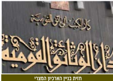
חזית בניין הארכיון המצרי

ורוסיה, שם נפתחו הארכיונים לאחר קריסת ברית המועצות. חומר ממקורות מצריים על המלחמה בהיבט הצבאי ניתן למצוא רק בספריהם של מספר גנרלים מצריים, כמו שאזלי, גמאסי ואחרים, שפרסמו את זיכרונותיהם מאז. הארכיון גם אינו מכיל את מסמכי משרד החוץ והשגרירויות המצריות בחו"ל, וגם לא מסמכים הקשורים לתחום הפשיעה ולעבריינים, זאת למרות שעל פי החוק המצרי על כל המשרדים הממשלתיים