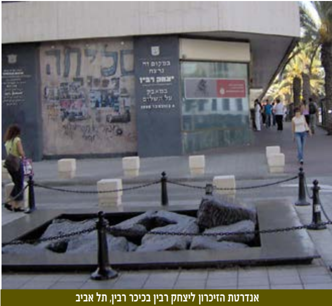
אנדרטת הזיכרון ליצחק רבין בכיכר רבין, תל אביב

4 בנובמבר 1995 | רצח רבין: כישלון צורב של מערך האבטחה של השב"כ.