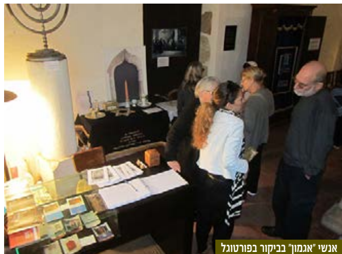
אנשי 'אגמון' בביקור בפורטוגל