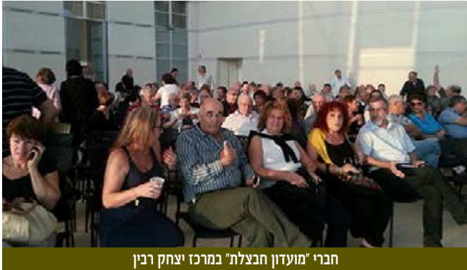
חברי 'מועדון חבצלת' במרכז יצחק רבין