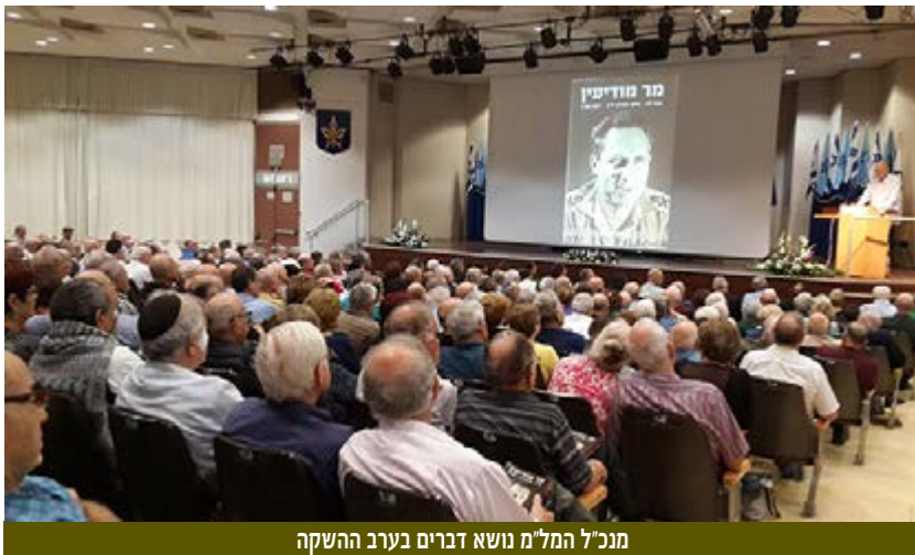
מנכ"ל המל"מ נושא דברים בערב ההשקה