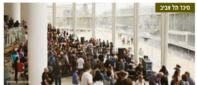
סיגד תל אביב

■ הסיגדיאדה - ב-18 באוקטובר 2013 קיימה עיריית תל אביב את פסטיבל חג הסיגד, החג החשוב לקהילה האתיופית בישראל. האירוע נערך ברחבה שבכיכר התיאטרון הלאומי 'הבימה' ובאולמותיו, והשתתפו בארגונו חברים ב'אגמון' במסגרת פעילות העמותה לפיתוח מנהיגות צעירה בקהילה האתיופית. האירוע זכה להצלחה גדולה מאד.