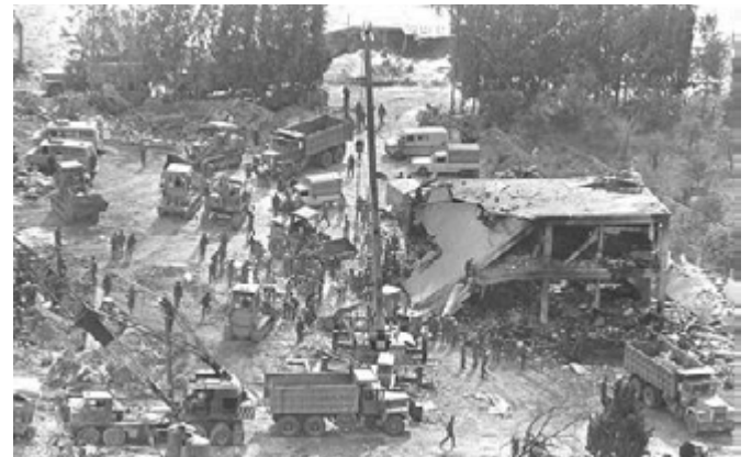
אסון צור השני

5 בנובמבר 1992 | אסון צאלים ב': כתאונת אימונים של סיירת מטכ"ל בצאלים נהרגו חמישה מהלוחמים, שנטלו חלק באימון ושישה נפצעו. מטיל שנורה בטעות במהלך תרגיל של מבצע של הסיירת.