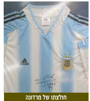
חולצתו של מרדונה