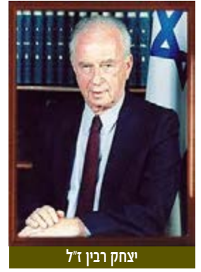
יצחק רבין ז"ל