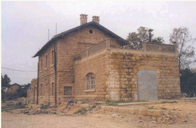
תחנת הרכבת התורכית בבאר שבע

חברי עמותת ש.מ. 2 פנו לאחרונה לראש עיריית באר שבע, רוביק דנילוביץ', בבקשה להנציח את מורשת היחידה ותרומתה לדרום ע"י הפיכת תחנת הרכבת התורכית בבאר שבע לאתר מורשת של היחידה.