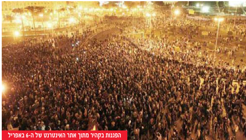
הפגנות בקהיר

מאז החל גל הזעזועים הנוכחי בארצות ערב התגברה גם השתתפות אנשי אקדמיה באמצעי התקשורת ובימי עיון לקהל הרחב. ערב העיון שנערך באוניברסיטה הפתוחה ב- 6 במרץ 2011 תחת הכותרת "מצרים בפתח תקופה?" משך קהל רב, כולל וותיקי קהילת המודיעין ולובשי מדים. ארבעת הדוברים ניתחו היבטים חשובים ברקע האירועים, כגון השפעת תפוצתה הרחבה של האינטרנט על הלכי הרוח, על הצבר התסכולים והתחזקות היכולות הארגוניות של הנוער המתוסכל, כפי שהדגים ד"ר מצטפא כבהא מהאוניברסיטה הפתוחה, מומחה להיסטוריה של התקשורת הערבית.