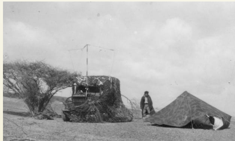
חוליית האזנה ניידת בדרום

בנוסף, הובטח מעיריית באר שבע לבחון בחיוב דרך לציין את העובדה שהיחידה הייתה חלק מההיסטוריה של המקום. (לפרטים נוספים ראה ידיעות הנגב, 25 בפברואר 2011).