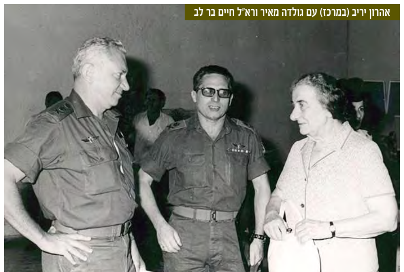
אהרון יריב (במרכז) עם גולדה מאיר ורא"ל חיים בר לב