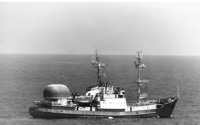
ספינת האזנה סובייטית מול חופי ישראל, 1972