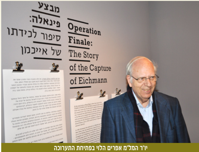
יו"ר המל"מ אפרים הלוי בפתיחת התערוכה

למעלה מחמש מאות אורחים ומכובדים, ביניהם כל משתתפי המבצע ובני המשפחות (מוסד, שב"כ, אנשי 'אל על' ואחרים) התכנסו ביום חמישי ט"ז תשע"ב (9 בפברואר 2012) לאירוע הפתיחה בבית התפוצות של תערוכת המוסד 'מבצע פינאלה' - סיפור לכידתו של אדולף אייכמן.