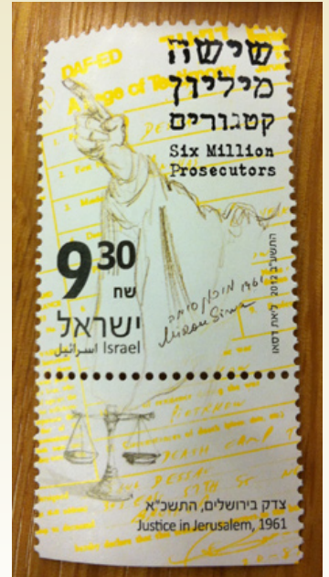
בול מיוחד לציון 50 שנה ל'מבצע פינאלה'