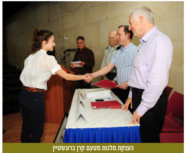
הענקת מלגות מטעם קרן ברונשטיין

בפעם ה-21 ברציפות התכנסו במל"מ ביום שלישי, כ"ט בטבת תשע"ב (24 בינואר 2012) אנשי היחידה הטכנולוגית באמ"ן ומפקדיה וחברי עמותת יוצאי היחידה (עמי"ט) לערב שבו הוענקו ארבע עשרה מלגות לימודים מטעם קרן הטכנולוגיה ע"ש דוד ברונשטיין ז"ל לנשים חיילים משוחררים ושמונה חיילות משוחררות הלומדים לימודים אקדמיים בתחומי ההנדסה, המדעים והטכנולוגיה. כל אחד ממקבלי המלגות קיבל מלגה בסך - 10,000 ש"ח: 6,000 ש"ח הוענקו במעמד הטקס, והיתרה תוענק לכל אחד מהם לאחר השלמת 80 שעות פעילות התנדבותית לטובת הקהילה.