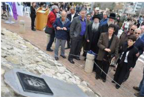
טקס הסרת הלוח מהאנדרטה.

האנדרטה ע"ש לוחם המוסד אלי כהן הי"ד, שנפל על משמרתו בדמשק בשנת 1965, נחנכה מחדש בטקס רשמי בעיר נצרת עילית בכ"ט בטבת תשע"ב (24 בינואר 2012).