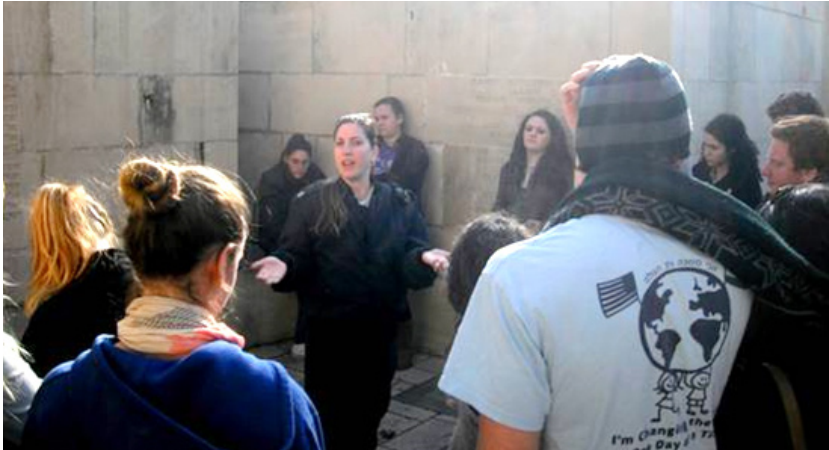
בני נוער מתנועת "הודה הצעיר" מארה"ב ומבריטיניה בביקור במל"מ במסגרת "מי חוויה מודיעינית לנוער"