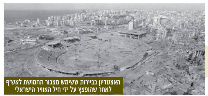
האצטדיון בכיכר ששימש מצבור תחמושת לאש"ף לאחר שהופצץ על ידי חיל האוויר הישראלי

6 ביוני 1982 | פרוץ מבצע "שלום הגליל" - מלחמת לבנון הראשונה. חלקו של המודיעין בהיערכות למלחמה ובמהלכה היה חשוב ומשמעותי מאוד. לראשונה הופעל מזל"ט בלחימה.