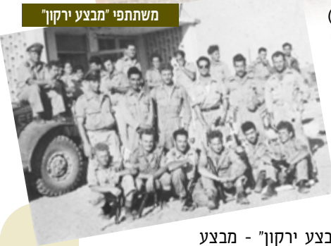
משתתפי "מבצע ירקון"

30 ביוני 1948 | תחילת "לידתה" של קהילת המודיעין הישראלית הכוללת שלושה גופים: שירות המודיעין הצבאי (ש"מ) - פקודה בשם הרמטכ"ל על הקמת השירות ופירוק הש"י. איסר בארי, מפקד הש"י עד אז, כינס את מפקדיו והודיע על פירוק הש"י ועל הקמת ש"מ. המהלך הוקפא עד ל-22 ביולי בשל התנגדות ראש אג"מ, ינאל ידן. השב"כ