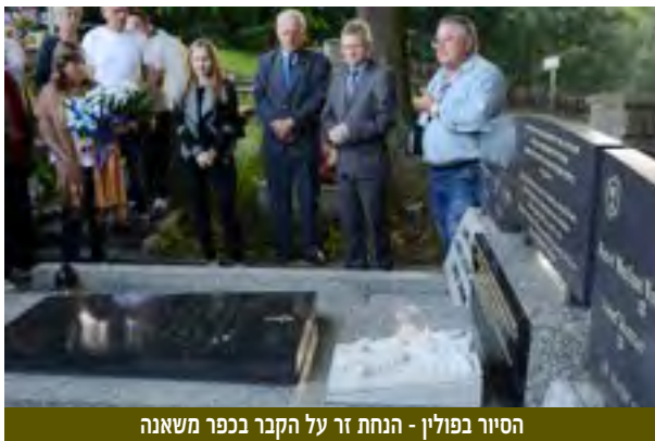
הסויר בפולין - הנחת זר על הקבר בכפר משאנה