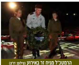
הרמטכ"ל מניח זר באירוע

ביום שלישי 6 ביוני 2013 התקיים באתר ההנצחה במרכז למורשת המודיעין בגלילות טקס ההתייחדות השנתי לזכר חללי קהילת המודיעין. הטקס, אשר נערך בסימן 40 שנה למלחמת יום הכיפורים, התקיים במעמד שר הביטחון משה (בוגי) יעלון, ראש שירות הביטחון הכללי יורם כהן, נציג המוסד, ראש המטה