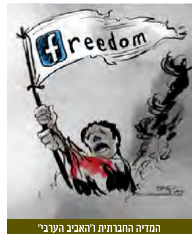
המדיה החברתית ו"האביב הערבי"