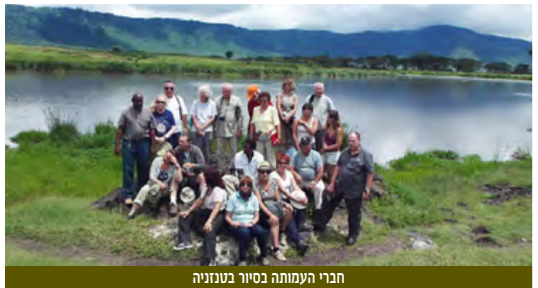
חברי העמותה בסויר בטנזניה