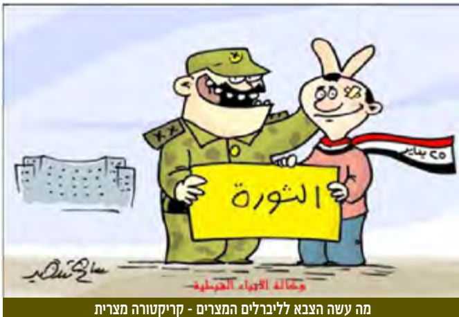
מה עשה הצבא לליברלים המצרים - קריקטורה מצרית

כ-150 מהם לצרכני המידע השונים. בעידן "התפוצצות המידע" תפסה מקום נכבד ה"ויזואליזציה של המידע". התוצר האוסניטי, המוגש כיום לצרכני המודיעין, מעוצב בתמונות וידאו המציגות להם את המתרחש באופן מוחשי יותר מערימות הטקסט בעבר. צרכני המידע מעדיפים לצפות בתוצר מודיעיני ויזואלי מתכלל בן מספר דקות על פני קריאה של אלפי מסמכים. התוצר האוסניטי כיום הוא "שיווקי" מאד ומחובר במשקים שונים לתחומי מודיעין נוספים.