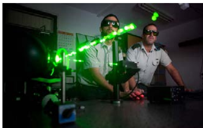
על מודיעין וטכנולוגיה

קברניטים ודעת קהל דורשים יותר מבעבר תשובות מן המודיעין לשאלה "מה יהיה", ולא רק בנושאי צבא, טרור ומדיניות, אלא גם מפני אפשרות של אסון פינאנסי או פגעי טבע. במקום שבו אין בידי המודיעין איסוף מעולה ובהיעדר מוכנות מודיעינית, נאלץ המודיעין לייצר הערכה. מעצם טבעו