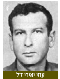
עוזי יאירי ז"ל

טקס חלוקת פרס ראמ"ן לחשיבה יוצרת ע"ש אל"מ עוזי יאירי ז"ל התקיים לאחרונה במוזיאון ארץ ישראל ברמת אביב. השנה ציין הפרויקט 39 שנים לקיומו. לרגל האירוע יצא לאור וחולק אשגור מורשת לזכרו של עוזי ז"ל, אשר תיאר גם את אופן ההתנעה של הפרויקט בתקופה שאמ"ן צריך להתמודד