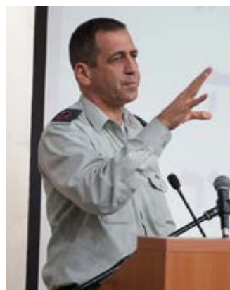
ראש אמ"ן, אלוף אביב כוכבי

ראש אמ"ן אלוף אביב כוכבי הדגיש, בסיכום היום, כי האירוע אינו אירוע נוסטלגיה אלא "אירוע למידה". הוא ציין כי גם הלוחמ"מ הוא תוצר של