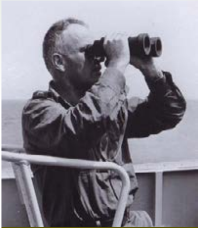
אלוף בנימין תלם ז"ל, מפקד חיל הים במלחמה

חלק גדול מהדיון עסק ביכולתו של המודיעין הימי להשפיע על המחקר באמ"ן ועל הקברניטים בעיקר בסוגיה של ההתרעה המודיעינית. מספר דוברים הצרו על כך שהערכתם בדבר המלחמה הצפויה, לאור