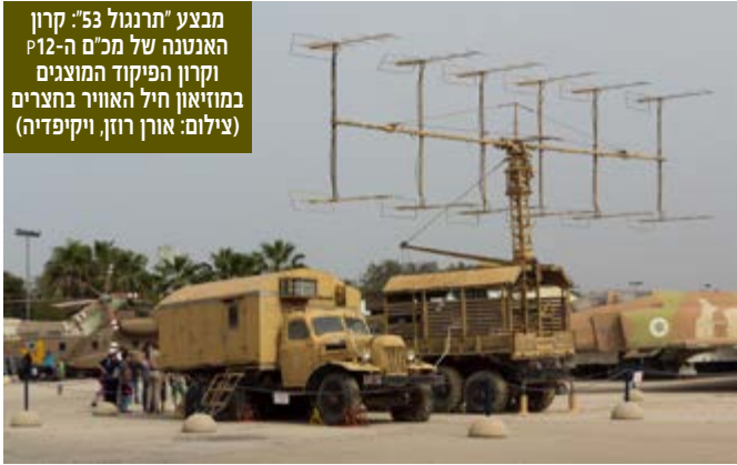
מבצע "תרנגול 53": קרון האנטנה של מכ"ם ה-P12 וקרון הפיקוד המוצגים במוזיאון חיל האוויר בחצרים

מודיעיני כולל למבצע. שירותי המודיעין המערביים "עטו" על המכ"ם הסובייטי.