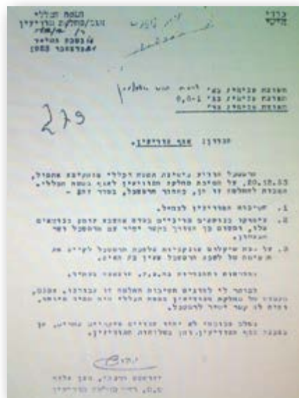
ממסמכי ההקמה של אמ"ן, דצמבר 1953