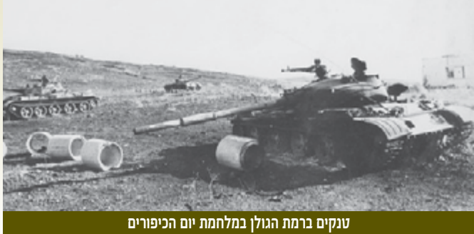
טנקים ברמת הגולן במלחמת יום הכיפורים

במטה האוגדה בנפח כשבוע לפני המלחמה בראשות שר הביטחון דיין, על "הדרכים לכיבוש... כוונת".