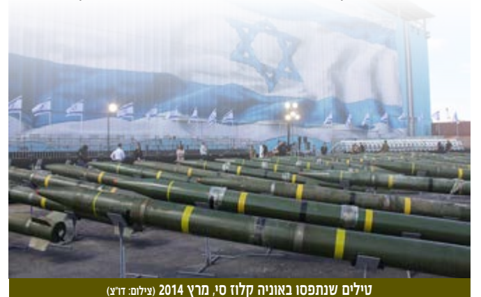
טילים שנתפסו באוניה קלזו סי, מרץ 2014

רשימת האיומים שהציג רח"ט מחקר כללה, בין השאר, את איראן ואת לוחמת הסייבר, את סוגיית הגרעין והטק"ק, את חזבאללה ואת התחזקות כוחו של האסלאם הרדיקאלי. בהתייחסו לשינויים בסביבה האופרטיבית של ישראל, ציין ברון כי בתקופה האחרונה חלה הפחתה בחלק מאיומים על ישראל (האיום הצבאי הקונבנציונלי