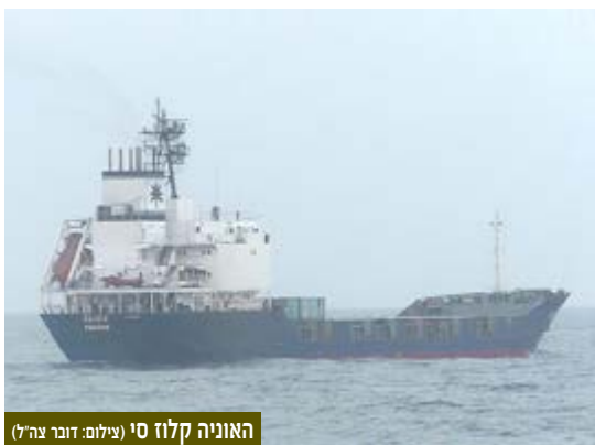
האוניה קלוז סי

במסגרת זאת, תוארה בהרחבה הפעילות מול האוניה קלוז סי (KLOS C) שהובילה טילים ואמל"ח נוסף מאיראן לרצועת עזה, נתפסה בים האדום והובלה לאילת.