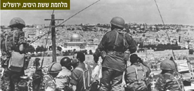
חפ"ק חטיבת הצנחנים בפיקודו של מוטה גור בהר הזיתים לפני הפריצה לעיר העתיקה

10-5 ביוני 1967 - מלחמת ששת הימים בין ישראל לבין מצרים, ירדן, סוריה ולבנון | המלחמה החלה במכה מקדימה של חיל האוויר נגד שדות התעופה של מצרים ("מבצע מוקד"), ואפשרה השגת עליונות אווירית מוחלטת לצה"ל בהמשך המלחמה. גופי מודיעין רבים בצה"ל (ובפיקודים) והמוסד היו שותפים להכנות ולהצלחתו המרשימה של המבצע.