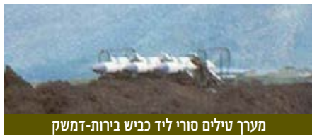
מערך טילים סורי ליד כביש בירות-דמשק