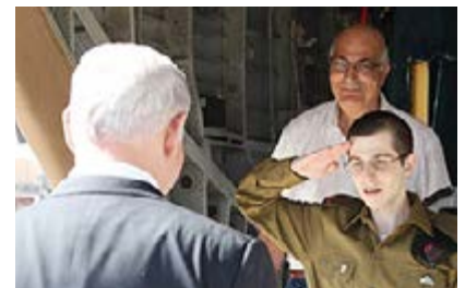
גלעד שליט מצדיע לראש הממשלה עם חזרתו מהשבי

21 ביוני 1972 - "מבצע ארגז 3" | לוחמי סירת מטכ"ל השתלטו על סיור של קציני צבא סורים בכירים, במטרה שישמשו קלף מיקוח לשחרור הטייסים גדעון מגן ובעוז איתן והנווט פיני נחמני, שהיו שבויים בידי הסורים. המבצע נערך מערבית לעיתא א-שעב לאחר קבלת מידע מודיעיני על הגעת קצינים בכירים סורים לסיור באזור. בין הקצינים הסורים שנלכדו היו קצין מודיעין בדרגת זע"ם (תת-אלוף), שני קציני מבצעים בדרגת עקיד (אל"מ) ושני טייסים בדרגת מקצם (סא"ל). ב-3 ביוני 1973 יצאה לפועל עסקת חילופי השבויים, והישראלים שבו לביתם.