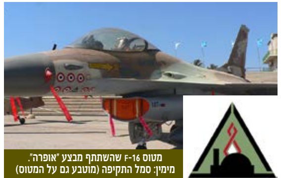
מטוס F-16 שהשתתף במבצע "אופרה" מימין: סמל התקיפה (מוטבע גם על המטוס)

7 ביוני 1948 - הקמת הש"י הצבאי | דוד בן גוריון, ראש הממשלה ושר הביטחון של המדינה שזה עתה קמה, זימן אליו את ראובן שילוח, איש המחלקה המדינית של הסוכנות היהודית, ואת איסר בארי, ראש הש"י והחליט (ע"פי יומנו): "יש להקים שרות ידיעות צבאי ע"י המטה... הש"י הצבאי יהיה אחראי לביטחון (זהירות), צנזורה ואנטי ריגול. שרות ידיעות פנימי תחת איסר (הקטן) ויוסף י... שרות ידיעות מדיני חיצוני - ראובן שילוח יעמוד בראשו. יהיה כפוף עד תום המלחמה למשרד הביטחון; אחר כך אולי למשרד החוץ."