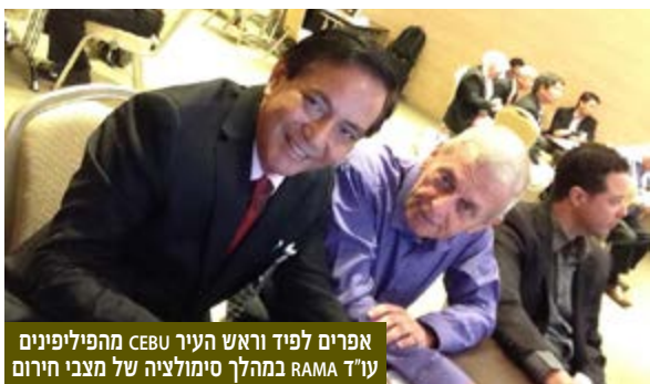
אפרים לפיד וראש העיר CEBU מהפיליפינים עו"ד RAMA במהלך סימולציה של מצבי חירום

המרכז למורשת המודיעין (מ"מ) | אתר ההנצחה | ת"ד 3555 רמת השרון 47143 | טל: 03-5497019, פקס: 03-5497731 | דוא"ל: mlm@intelligence.org.il