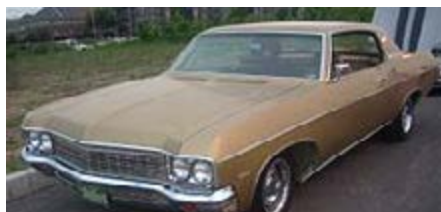
שברולט האימפלה מהדגם שנחטף לישראל ובו נסעו הסורים

25 ביוני 2006 - החייל גלעד שליט נחטף לעזה | מידע התרעתי על כוונות המחבלים לבצע פיגוע חטיפה, שהיה קיים במערכת, לא מוצה.