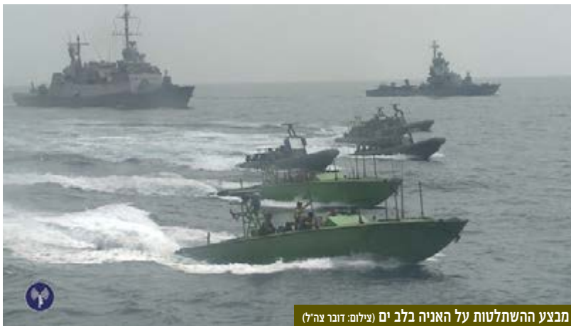
מבצע ההשתלטות על האניה בלב ים