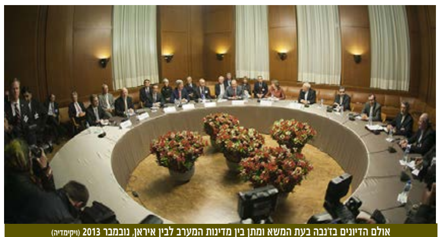
אולם הדיונים ב'זנבה בעת המשא ומתן בין מדינות המערב לבין איראן, נובמבר 2013 (ויקימדיה)

פרופ' ליטבך העריך, כי הסיכוי שהאיראנים יוותרו על חלום הגרעין קלוש. למעשה, בזכות ההסכם קבלו האיראנים אישור להחזיק צנטריפוגות והכרה במעמד של מדינת סף גרעינית. מדובר מבחינתם בהישג לא קטן. בתקופת ההסכם הם ישמרו על יכולות גרעיניות וידע ויכולו להחליט אם להמשיך ולקיימם או לא. דגן הוסיף, כי בעת משבר, בלוח זמנים קצר של שנה שנתיים, יוכלו האיראנים להגיע ליכולת גרעינית. גם אם לא יהיה מדובר ביכולת גרעינית המשך בעמוד 3