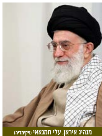
מנהיג איראן, עלי חמנאאי

ליטבך ציין, כי בחירת רוחאני לנשיא איראן שיקפה מסר למנהיג העליון חמנאאי שהעם האיראני מצפה לנקיטת מדיניות פרגמטית יותר כלפי המערב, אך ללא ויתור משמעותי על האסטרטגיה הקשורה במדיניותו בשאלת הגרעין. דגן הדגיש את עומק המשבר הכלכלי שבו הייתה שרויה איראן בעקבות הסנקציות הכלכליות שהטיל עליה המערב. אולם, להערכתו עיתוי ההחלטה האמריקאית לפתוח במו"מ להשגת הסכם עם המערב קשור היה בחשש אמריקאי שבכוונת ישראל לתקוף את מתקני הגרעין באיראן, מהלך שיגרם לפגיעה באינטרסים אמריקאים.