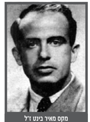
מקס מאיר בינט ז"ל

לאחרונה עלה לאוויר אתר אינטרנט חדש על מאיר מקס בינט (27 יוני 1917 - 21 דצמבר 1954) לוחם סתר של המודיעין הישראלי שפעל במצרים בשנים הראשונות שלאחר הקמת המדינה. תחת זהות של נציג חברה גרמנית