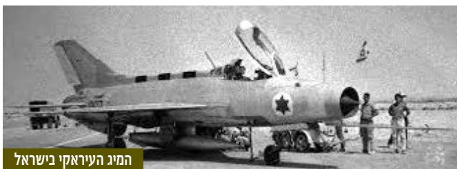
המיג העיראקי בישראל