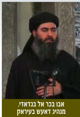
אבו בכר אל בגדאדי, מנהיג דאעש בעיראק