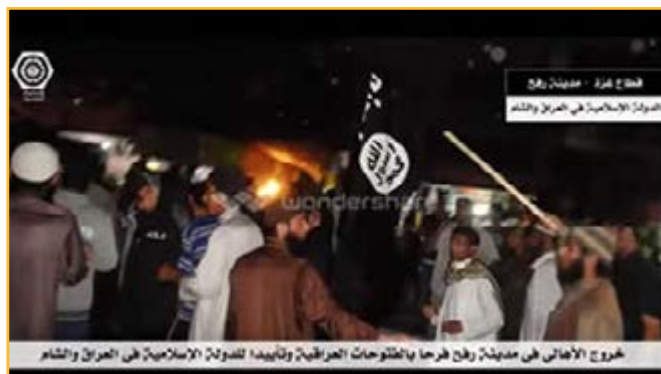
מפגן תמיכה של תושבי רפיח הפלסטינית בדאעש, אשר פוזר ע"י משטרת החמאס