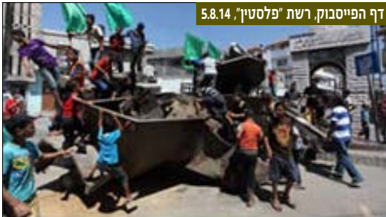
דף הפייסבוק, רשת "פלסטין", 5.8.14

במהלך "צוק איתן" היו קרוב לחצי מיליון כניסות לאתר האינטרנט של מרכז המידע למודיעין ולטרור. למידע עדכני על המצב: www.terrorism-info.org.il