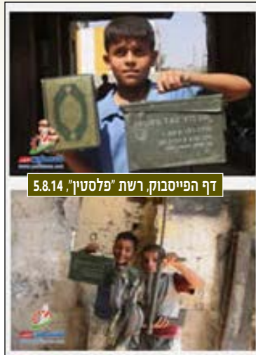
דף הפייסבוק, רשת "פלסטיין", 5.8.14

מערך האיסוף הופעל מעמדות קדמיות בשטח ומאמצעים הפרוסים לרוחב הגזרה. התצפיתניות שפעלו מתוך חמ"לי האיסוף צפו לא רק לעומק השטח, והתמקדו בסריקת השטח הקרוב לנבול כדי לאתר חוליות אויב שפעלו מתוך מנהרות התקיפה. התצפיתניות, האמונות על הכיסוי השוטף של הגזרה, פעלו באינטנסיביות רבה, והצליחו לאתר ולהתריע במספר מקרים על חוליות חמאס אשר יצאו ממנהרות תקיפה בשטחנו, במטרה לבצע פיגוע הרג וכיוונו את הכוחות הלוחמים לסיכול הפיגוע. עם היציאה למאמץ תקיפה קרקעי, השתלבו בלחימה מערכי מודיעין השדה, מחלקות המודיעין ברמת הפיקוד, האוגדות, הגדודים והיחידות המיוחדות. כל אלה זכו להיעזר במערכות הלוחמ"מ (לחימה מבוססת מודיעין) שפותחו באמ"ן. המודיעין המבצעי המדויק הגיע הישר אל המפקדות והמפקדים גם בדרגי השדה הנמוכים.