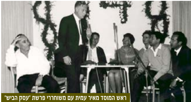
ראש המוסד מאיר עמית עם משוחררי פרשת "עסק הביש"