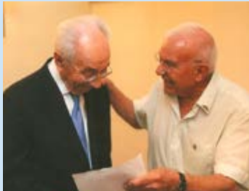
הנשיא היוצא פרס ואברהם ברזילי

נשיא המדינה שמעון פרס נפרד מעובדות ומעובדי המוסד בסדרת אירועים וביניהם תערוכה של מוזיאון המוסד שהוכנה עבורו והציגה כתבי קודש שחולצו ממדינות ערב וכאלה שהיו קשורים לאירועים בהיסטוריה של