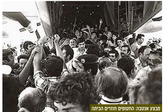
מבצע אנטבה: החטופים חוזרים הביתה

4 ביולי 1976 - מבצע "כדור הרעם" ( יונתן/אנטבה) | מבצע שחרור החטופים הישראלים והיהודים של מטוס "איר פראנס" שנחטף ב-27 ביוני 1976 והונחת באונגדה. על אף המרחק לאנטבה יצאו כוחות מיוחדים וביניהם סיירת מטכ"ל, חטיבת גולני ואחרים במטוסי חיל האוויר למשימת החילוץ. רוב החטופים חולצו בשלום, אך חמישה ישראלים נהרגו, בהם מפקד סיירת מטכ"ל, יוני נתניהו ז"ל.