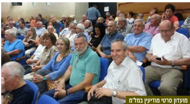
מועדון סרטי מודיעין במל"מ

סרטו של מייקל אפנד "אניגמה" משנת 2001, על המאמץ לפצח מחדש את הקוד שבו העבירו הנאצים במלחמת העולם השנייה מידע בין הצוללות לבין צי הספינות, עומד בליבו של סרט המודיעין שהוקרן במל"מ ביום שלישי 8 ביולי 2014. הסרט עוקב אחר פעילותה של מחלקת פענוח הצפנים בצבא הבריטי, חושף הקשרים מעולם הסיגינט והיומינט, האנשים העוסקים במלאכה והיחסים ביניהם, וכמובן ברוח התקופה חושף שגם לנשים היה תפקיד בפיצוח קושיות מתמטיות. פרופ' יגאל שפי הרצה במקצועיות ובצורה מרתקת על מודיעין ותרבות פופולארית: סיגינט וייצוגו בקולנוע. אזעקת "צבע אדום" שנשמעה לראשונה גם במל"מ, ומשחק הגמר באותו ערב בכדורגל בין גרמניה לארגנטינה, לא פגעו בהנאה השלמה של הנוכחים.