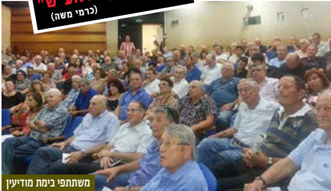
משתתפי בימת מודיעין

היא מקדמת, במיוחד מאז הפלישה הסובייטית לאפגניסטן ב-1979, חינוך אסלאמי (דעוה) ורשתות חברתיות, ובאמצעים של מימון והשפעה, חותרת להפיץ אסלאם רדיקאלי מהפכני הפועל כיום: נגד השליטים במדינות המרחב, המואשמים שסטו מדרך האסלאם; וכן לשאת את נס המאבק נגד המערב.