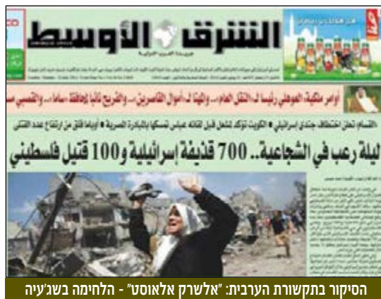
הסיקור בתקשורת הערבית: "אלשרק אלאוסט" - הלחימה בשג'יעה

במאמץ המודיעיני המתמשך השתלבו כלל המערכים: המערך הסיגניטי ריכז מאמצים, יחד עם