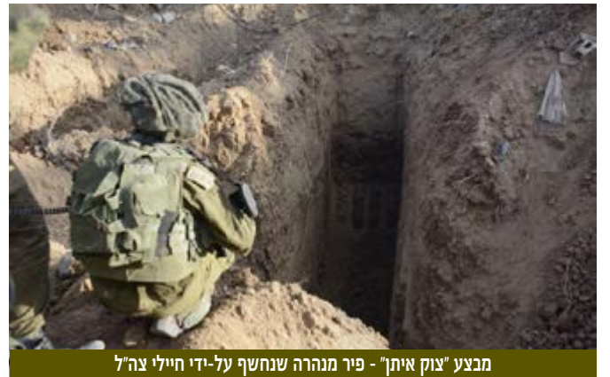
מבצע "צוק איתן" - פיר מנהרה שנחשף על-ידי חיילי צה"ל

אחת השאלות המרכזיות שעליה ביקשו מענה כ-200 ממשתתפי יום העיון של העמותה להיסטוריה צבאית על "איום המנהרות האם הופתענו?" הייתה "האם המודיעין הופתע?" גם אם המשתתפים לא קבלו תשובה חד משמעית, נראה שהתחושה הכללית הייתה ש"ידענו ובכל זאת הופתענו". ביום העיון השתתפו אלוף (מיל) דורון אלמוג, לשעבר מפקד פיקוד דרום,