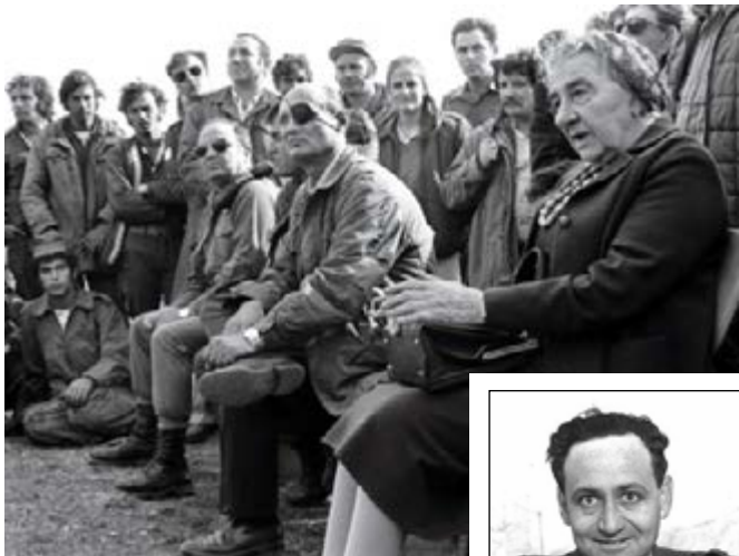
גולדה ודיין בביקור בחזית ברמת הגולן, 1973