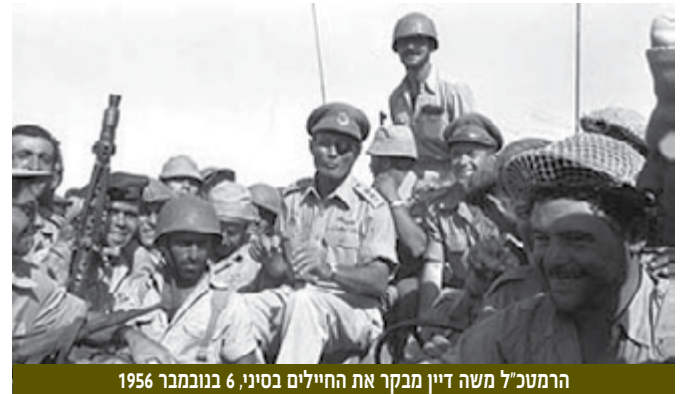
הרמטכ"ל משה דיין מבקר את החיילים בסיני, 6 בנובמבר 1956

29 באוקטובר - 5 בנובמבר 1956 - מלחמת סיני ("מבצע קדש") | המודיעין הצבאי והעומד בראשו, יהושפט הרכבי, מילאו תפקיד מרכזי בהכנות, בעיקר בתיאומים עם בריטניה וצרפת, וכך גם בתכנון ובביצוע מהלך ההונאה ובהכנות ללחימה. עלייה בולטת במקומו של הסיגינט באיסוף המודיעין. לאחר שכבשה את רצועת עזה וסיני, נאלצה ישראל לסגת נוכח לחץ בינלאומי.