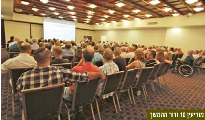
מודיעין 10 ודור ההמשך

ב-16 בספטמבר 2014 נערך כנס "דור ההמשך" של העמותה הכולל קצינים ונגדים, אשר שירתו שירות קבע ביחידה החל משנות השבעים. מטרת הכנס הייתה להזרים דם חדש לעמותה ולגבש מתכונת לשילוב דור ההמשך בפעילותה. באירוע נכחו כ-140 משתתפים והוא נערך בהשתתפות מפקדי היחידה לדורותיה, סגל הפיקוד הבכיר של היחידה הסדירה והנהלת העמותה.