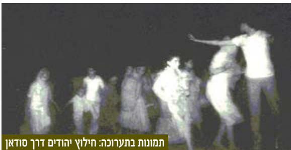
תמונות בתערוכה: חילוף יהודים דרך סודאן

המוסד חשף, במסגרת ערב החברים השנתי שנערך במל"ם, תערוכת צילומים, אשר חלקם הוצגו לראשונה מחוץ לכותלי הארגון. התערוכה נתנה הצצה לחיים באתיופיה ובמחנות בסודאן, לכפר הנופש והצלילה שהוקם בסודאן ככיסוי