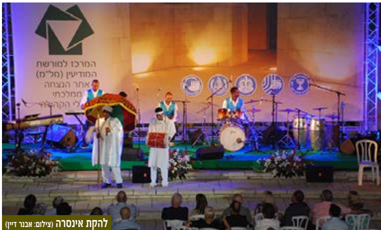
להקת אינסרה

המרכז למורשת המודיעין המל"מ, אתר ההנצחה הממלכתי לחללי קהילת המודיעין, קיים ביום שני 15 בספטמבר 2014 את כנס החברים השנתי ה-29 בתיאטרון הפתוח של המל"מ. הכנס נערך הפעם בסימן שלושים שנה ל"מבצע משה", המסע המופלא של בני יהדות אתיופיה ובנותיה ברגל, בים ובאוויר לישראל. במהלך הערב הוצגו סיפורי אמ"ש (ראשי תיבות אמ"ן, מוסד, שב"כ) על המבצע המופלא והמרגש הזה.