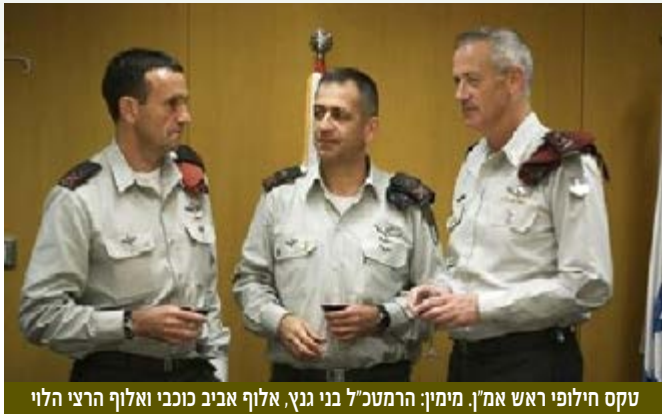
טקס חילופי ראש אמ"ן. מימין: הרמטכ"ל בני גנץ, אלוף אביב כוכבי ואלוף הרצי הלוי

גבולותיו במחצית הראשונה של המאה הקודמת. גבולות נמחקים, מדינות מתבטלות, העזו לחרב, העזו לשלום וחיי אדם, כפי שנאמר בתפילת יום הכיפורים "כאבק פורח וכחרס הנשבר". אין לנו אלא לפעול מול כל אלה בפעולה משותפת בתוכנו, בשיתוף פעולה עמוק עם כלל הגופים בצה"ל ועם הארגונים העמיתים בקהילת המודיעין. נפעל בשותפות, תוך גילוי פתיחות וגמישות ומתוך צניעות המכירה בסופיותה של הידיעה ובאין סופיותה של אי הידיעה. בגודל האתגר בתפקיד זה, אני רואה יותר מכל דבר אחר את האנשים באגף המודיעין כמפתח להצלחתנו. כנות, שקיפות, ענייניות, אומץ ורעות יאפיינו את עשייתנו כאנשים וכמפקדים. הסתובבתי הרבה בשבועות האחרונים במערכי אגף המודיעין השונים בהם משרתים אנשים טובים, מוכשרים, חדורי מוטיבציה להוסיף, לעשות ולתרום לביטחון מדינת ישראל. לא כולם מכירים את שנעשה מאחורי הקלעים וטוב שכך, לא כולם יכולים להעריך זאת, ואנו נמשיך ונעשה שלא על מנת לזכות בהערכה ושתהיה תרומתנו משמעותית". להרחבה ראה באתר דובר צה"ל: