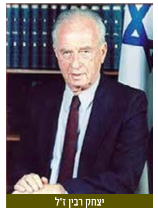
יצחק רבין ז"ל

4 בנובמבר 1995 - רצח ראש ממשלת ישראל יצחק רבין | כישלון צורב של מערך האבטחה של השב"כ ופגיעה בדמותו של השירות. כרמי גילון ראש השב"כ דאז התפטר מתפקידו.