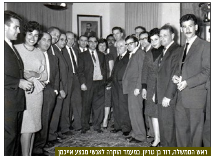
ראש הממשלה, דוד בן גוריון, במעמד הוקרה לאנשי מבצע איימן

11 במאי 1960 - חטיפת אדולף איימן והבאתו למשפט בישראל | מבצע מורכב וחשאי של המוסד, בו השתתפו גם אנשי יחידת המבצעים של השב"כ, במהלכו נלכד בארגנטינה הפושע הנאצי אדולף איימן והוטס לישראל. משפטו החל בירושלים ב-10 באפריל 1961. בסיומו, הורשע איימן בביצוע פשעים נגד העם היהודי ונגד האנושות, ונזר דין מוות שהוטל עליו הוצא לפועל בתלייה בכלא רמלה ב-1 ביוני 1962.