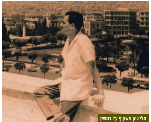
אלי כהן משקיף על דמשק