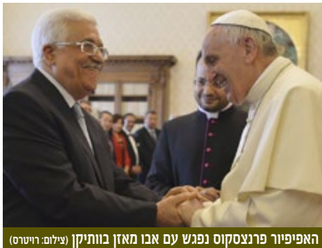
האפיפיור פרנצסקוס נפגש עם אבו מאזן בוותיקן