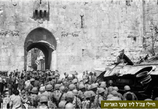
חיילי צה"ל ליד שער האריות