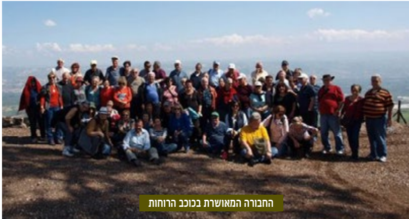
החברה המאשרת בכוכב הרוחות