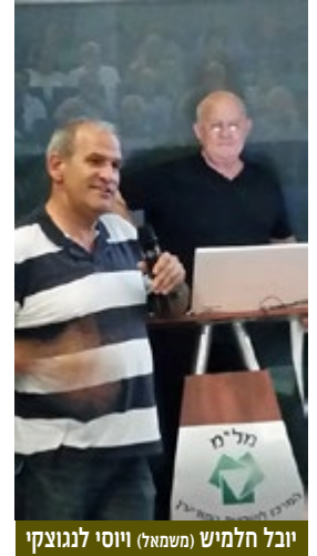
יובל חלמיש (משמאל) ויוסי לנגוצקי

המערכה לשחרור ירושלים במלחמת ששת הימים (1967) ובמיוחד תפקידה של החטיבה הירושלמית, עמדו בלב הרצאתו של אל"מ (מיל) יוסי לנגוצקי. הוא סקר את המצב הבעייתי ששרר בירושלים מאז מלחמת העצמאות ב-1948 ועד מלחמת ששת הימים ב-1967. הקו העירוני ששורטט, חצה את ירושלים והותיר בתום