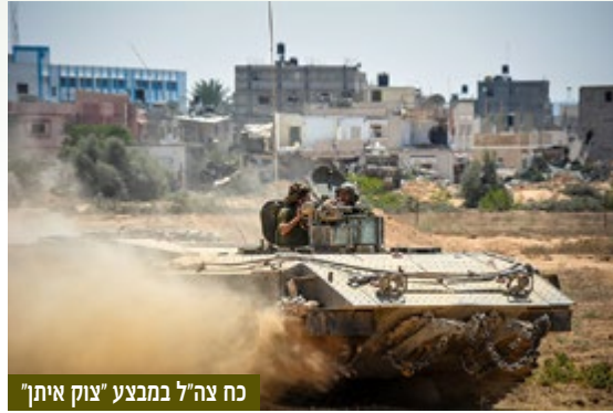
כח צה"ל במבצע "צוק איתן"

האחרים לא יחדשו את האש. זאת, משום שהם מצויים כעת בתחילתו של תהליך שיקום ארוך, הן במישור האזרחי והן בתחום חידוש היכולות הצבאיות של הארגון.