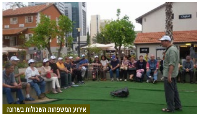
אירוע המשפחות השכולות בשרונה