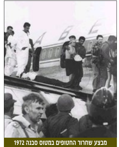
מבצע שחרור החטופים במטוס סבנה 1972

9 במאי 1972 - מבצע "איזוטופ" | שחרור בני הערובה נוסעי מטוס חברת 'סבנה', שנחטפו ע"י מחבלים חברי ארגון "ספטמבר השחור" לאחר המראתו מבלגיה. המטוס נחת בלוד ולוחמי סיירת מטכ"ל, בפיקודו של אהוד ברק, שהיה מפקדה, השתלטו על המטוס. ראש הממשלה בנימין נתניהו היה אחד ממפקדי החוליות שפיקדו על הכוח.