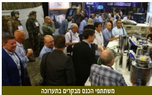
משתתפי הכנס מבקרים בתערוכה

גם הטכנולוגיה משתנה. היא עושה זאת בקפיצות ענק וגם לוחמת הסייבר הופכת להיות רכיב משמעותי בשדה הקרב. היכולת להביא מודיעין לדרג הלוחם בשדה הקרב בזמן אמת, או כמעט אמת, באמצעים טכנולוגיים משוכללים תורמת להגנת הלוחמים בשדה הקרב המסובך והמורכב. בה בעת, נוכח הדינמיות של שדה הקרב, נדרש היום איש המודיעין לתת מענה מודיעיני מדויק, מהיר ובזמן אמת כדי לאפשר פגיעה במטרות איכותיות, אך להימנע מפגיעה בבלתי מעורבים או מגרימת נזק סביבתי מיותר.