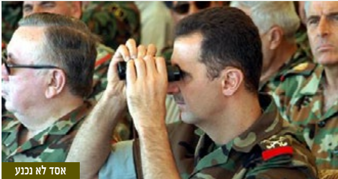
אסד לא נכנע

משטר אסד להחזיק באחיזתו בדמשק, בחמאת/חומס וברצועת החוף ימשך מצב שוויון הכוחות בין הצדדים. שגב העלה אפשרות שלאחר חתימת ההסכם עם איראן תבנה איראן, בהסכמת ארה"ב, עוצמה צבאית (עצמאית או באמצעות מיליציות) ותיצור מכפיל כוח שיכריע את המערכה בסוריה לטובת כינון משטר פרו-איראני. תהיה בכך מכה ניצחת למחנה הסוני. מנגד, קיימת גם אפשרות שארה"ב ומדינות סוניות מובילות יקיימו יכולת התערבות בסוריה ויכריעו את המצב לטובת משטר חדש בסוריה (לאחר שתושג הסכמה אמריקנית-רוסית?). כך או כך, שגב הדגיש את התפקיד הקריטי שיש למודיעין בניבוש תהליך קבלת ההחלטות ובניצול הזדמנויות, אם ישראל תשחק בקלפיה.