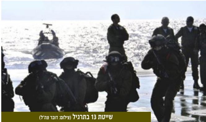
שייטת 13 בתרגיל

ומותם של מרבית אנשי הכוח ממארב וממטעני חבלה של החזבאללה, בציר התנועה. ועדת החקירה לבדיקת האירוע בדקה, בין השאר, את התהליך המודיעיני בניסיון לאתר דליפת מידע בערוץ יומיניטי או עקב כשל בטחוני-טכני בשידורי המזל"ט, שאפשרו מארב מתוכנן.