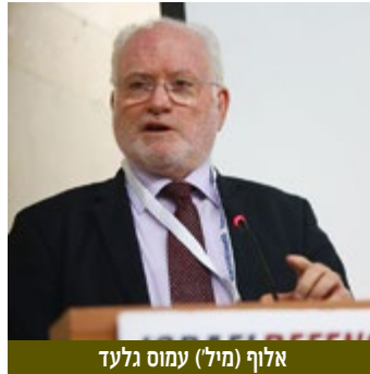
אלוף (מיל) עמוס גלעד

את הכנס בגני התערוכה פתח מנכ"ל המל"מ תא"ל (מיל) דודו צור שציינו, כי הכנס מטפל בנושאים רבים אשר הקו המאחד אותם הוא האתגרים והדילמות של המודיעין מול המצבים החדשים, המורכבים והמסובכים לאין ערוך ביחס לעבר, בכל הרבדים: הטקטי, האופרטיבי והאסטרטגי-מדיני. איש המודיעין, בין אם הוא מתחום האיסוף, המחקר המדיני או הצבאי, ניצב כיום מול מצבים דינמיים, המשתנים במהירות יחסית, והם דורשים מענה מודיעיני שונה מבעבר. לא ניתן להשוות את הקורה היום לעומת מה שקרה לפני 25 שנה - העולם היה אז מסודר, דו קוטבי, והחלוקה בין מי שייך למערב ומי שייך למזרח הייתה ברורה. המלחמות התנהלו בין מדינות. הצבאות היו גדולים ומסודרים, והם פעלו לפי דוקטרינה צבאית