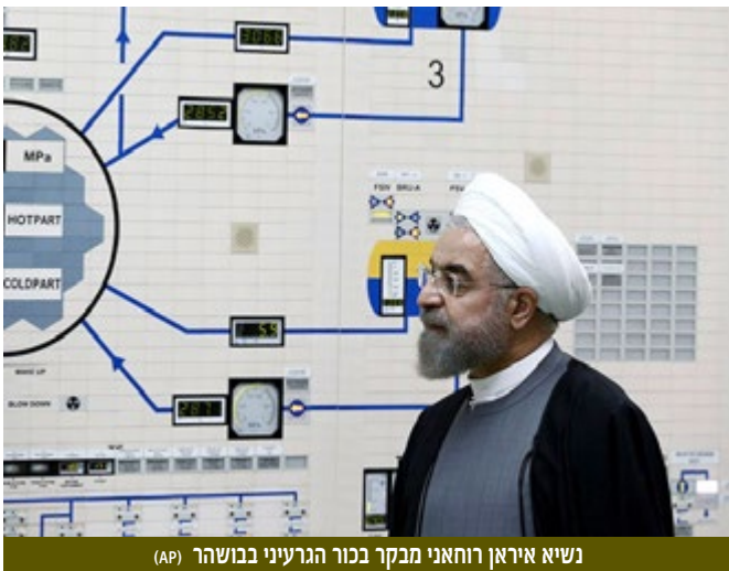
נשיא איראן רוחאני מבקר בכור הגרעיני בבושהר

קופרוסר טען כי "ישראל תצטרך לדעת איך איראן מתכוונת לעקוף ולהפר את ההסכם ואיך יהיה לה גרעין למרות ההסכם". "27 שנים חלפו מאז תחילת פרויקט הגרעין ולאיראן עדיין אין גרעין", אמר קופרוסר, "למרות שיכלה מזמן לפתח נשק גרעיני. זו בין היתר תרומת המודיעין הישראלי ויכולותיו, שזעק בעולם שיש תכנית גרעין איראנית, שיש פרויקט צבאי וצריך לעשות משהו. היו גם הפגנות כוח שהאטו את הפרויקט, וישראל הציבה את הנושא בראש סולם העדיפויות בעולם". היום יש מציאות חדשה נוכח ההסכם המתגבש, כי ישראל תיציב לבדה