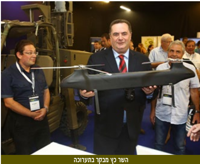
השר כץ מבקר בתערוכה

בתום המושב הראשון הופיע בפני באי הכנס מר ישראל כץ השר לענייני מודיעין, בהופעה פומבית ראשונה בפני אנשי קהילת המודיעין.