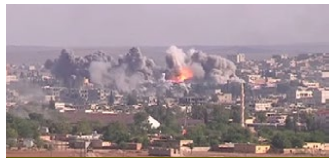
הפצצות אוויריות של כוחות הקואליציה על עמדות דאעש, נובמבר 2014

ממאזן הביניים של המערכה עד כה עולה, כי המערכה לא הצליחה לפגוע באופן משמעותי ביכולותיו הצבאיות והממשליות של דאעש, ולא הצליחה לצמצם באופן ניכר את אזורי שליטתו בסוריה ועיראק. באזורים שבשליטתו, ביסס דאעש מערכות ממשל מדינית, במסגרת הח'ליפות האסלאמית הכוללות מנגנוני משפט, אכיפת החוק, חינוך, בריאות, הפעלת שדות נפט וגז, הפעלת תחנת כוח ועוד. מערכות אלו לא נפגעו באופן משמעותי עד כה. הח'ליפות האסלאמית שבשליטת דאעש נותרה "מותג" בעל כוח משיכה רב למוסלמים מכל העולם. במהלך התקיפות נהרגו אמנם כמה אלפי פעילים אך חסרונם מולא ע"י פעילים זרים וגיוס מקומיים, סורים ולבנונים. ההתקפות האוויריות פגעו ב"דרגי עבודה", כמה מהם בכירים, אך לא הצליחו לחסל את הנהגת דאעש. את הכישלונות הבולטים נחל דאעש מידי הכוחות הכורדים (YPG) שבצפון סוריה,