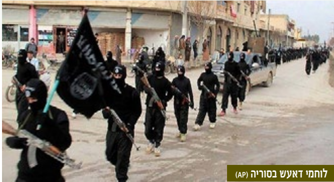
לוחמי דאעש בסוריה

שבקרבת הגבול התורכי. הישגים אלו הושגו בסיוע אווירי של ארה"ב והקואליציה, אולם כוחות הקרקע הכורדים מילאו בהם תפקיד משמעותי. ההצלחות הללו לא מונפו ע"י הכורדים לכיבוש אזורים שבשליטת דאעש ולהצבת אתגר משמעותי בפני הארגון.