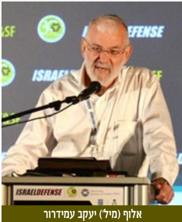
אלוף (מיל') יעקב עמידור

מול מה שייעשה באיראן. יתר המדינות והמעצמות לא ירצו לדעת מה קורה אם איראן תפר את ההסכם. "אנו משוכנעים שהאיראנים ירצו לייצר גרעין" .. ההסכם לא יכלול איסור תנועת מדעני גרעין לחו"ל. ישראל תצטרך לדעת איך איראן מתכוונת לעקוף ולהפר את ההסכם ואיך יהיה לה גרעין למרות ההסכם".