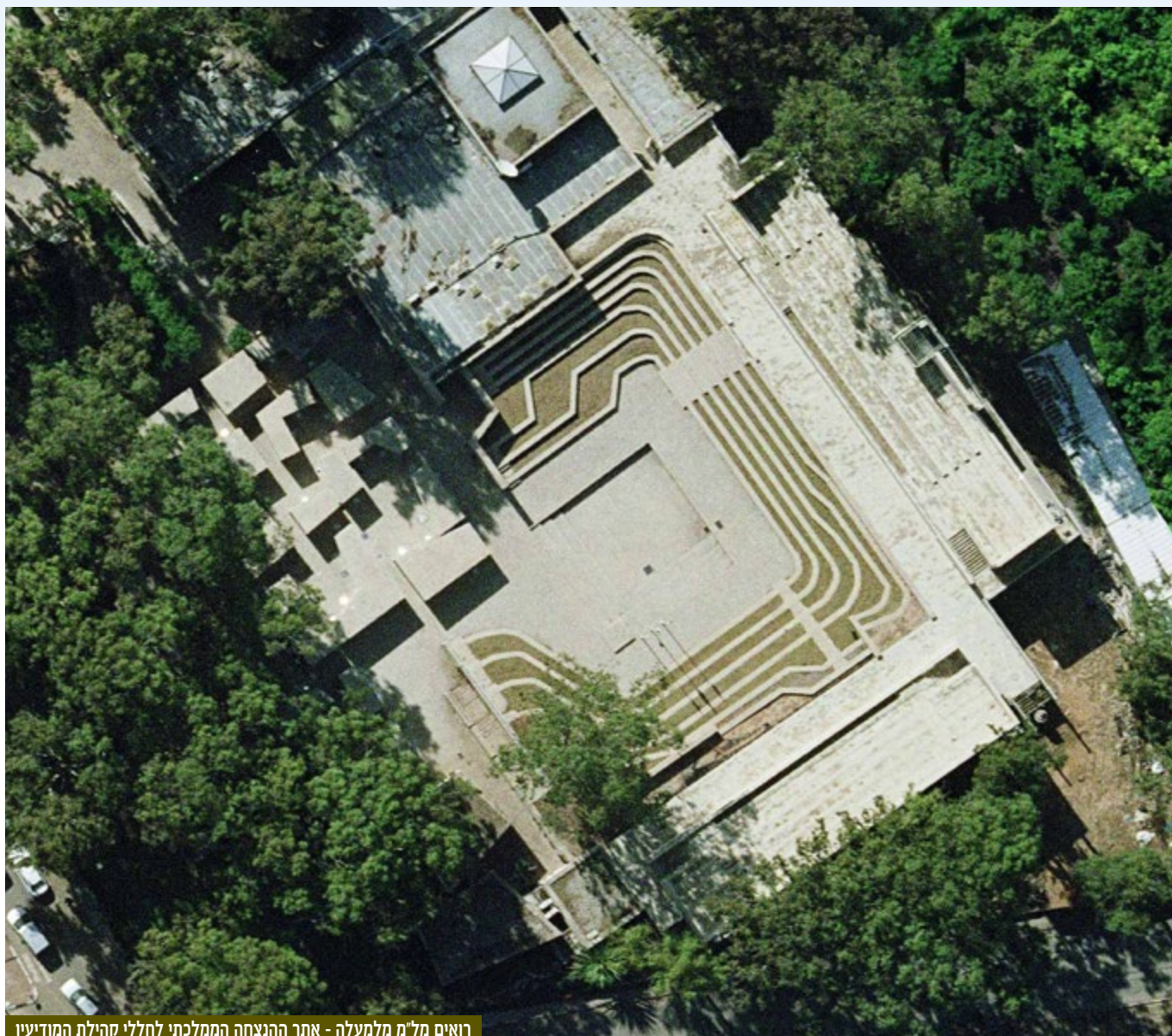
רואים מל"מ מלמעלה - אתר ההנצחה הממלכתי לחללי קהילת המודיעין