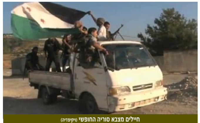
חיילים מצבא סוריה החופשי