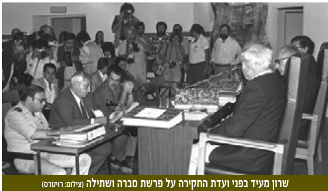
שרון מעיד בפני ועדת החקירה על פרשת סברה ושתילה

17 בספטמבר 1971 - הפלת מטוס ה"סטרטוקרוזר" של חיל האוויר במשימת צילום מול דזור-סואר ע"י טק"א מצרי | המטוס יצא עם צוות בן 8 איש לניחת צילום באזור תעלת סואץ לאיתור סוללות טילים סובייטיות חדשות. רק 2 ניצלו מפגיעת טיל ה-SA-2.