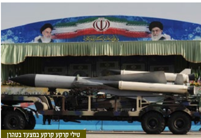
טילי קרקע קרקע במצעד בטהרן

באם נתבונן על המתרחש כיום בחזית רמת הגולן - בעבר היה שם צבא סורי סדור במסגרות של חטיבות ודיביזיות עם מבנה והיררכיה ברורים. כיום, פועלים בחזית רמת הגולן למעלה מ- 20 ארגוני מורדים עם אידיאולוגיות שונות, חלקן משותפות וחלקן מנוגדות. זאת, לצד ארגונים סמי-מדינתיים, כמו החזבאללה ודאעש, שלא ברור אם בתוך עצמם הם מצליחים לאבחן את ההבדלים. האויב חי היום מבוזר, מפוזר והוא פועל מתוך אוכלוסייה אזרחית, כחלק מאסטרטגית הפעולה