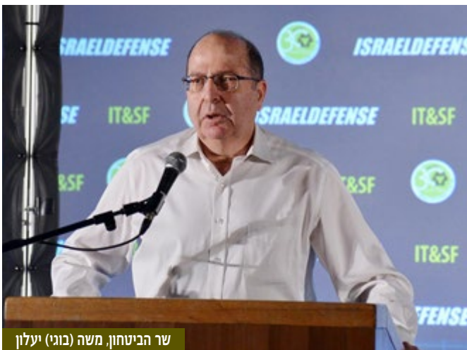
שר הביטחון, משה (בוגי) יעלון

אבל זה מכפיל כוח עצום. גם שיתוף פעולה בין מדינתי הוא הכרח. אלו יכולים להיות איראנים או ג'האדיסטים, אי אפשר לכסות לבד את כל הגלובוס. את זה אפשר לפתור רק בשיתוף פעולה גלובלי. חל שינוי לטובה מאז "אירועי מגדלי התאומים". אבל אין בזה די. מדינות המערב והמדינות הערביות המתונות מתמודדות עם טרור. שיתוף פעולה הוא הדרך שלנו לנצח".