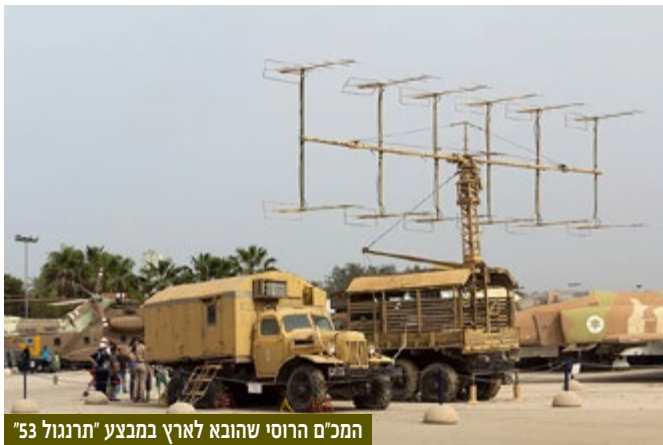
המכ"ם הרוסי שהובא לארץ במבצע "תרנגול 53"

26 בדצמבר 1969 - מבצע "תרנגול 53" | חטיפת מכ"ם רוסי לישראל. המבצע החל באיתור המכ"ם בתצ"א, שהביא ליוזמה מהמודיעין לא לתקוף אלא להביא המכ"ם לארץ. אחד המבצעים הנועזים במלחמת ההתשה.