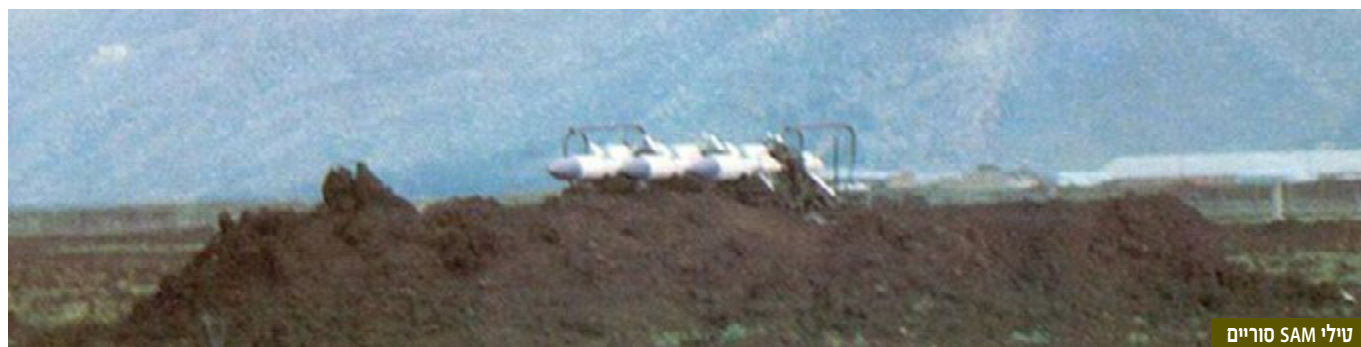
טילי SAM סוריים

במהלך ההרצאה נסקרו התהליכים שעברו בחיל האוויר בין שתי המלחמות. השמדת מערך הטילים הסורי ביטאה שינוי תפישתי עמוק בחיל האוויר לאחר מלחמת יום הכיפורים וההרצאה נועדה לתת מסגרת קונספטואלית לשינוי שחל בחיל האוויר, ולהק המודיעין שלו בכלל זה. במרכז השינוי עמד השינוי בתפיסת עולם (פרדיגמה) של החיל. החיל כולו אימץ את הגישה שניתן לשלוח מטוסים לתקיפת מטרות, בעלות ערכיות גבוהה או מוגנות היטב, מבלי שהטייסים ידעו על הקרקע איזו מטרה קונקרטית הם נדרשים לתקוף. לצורך זה התחולל שינוי מהקצה אל הקצה - באמצעי