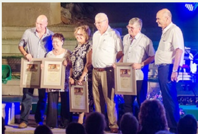
הענקת תעודות הוקרה למתנדבי המל"מ

מתודולוגיים ומעשיים בעבודת קהילת המודיעין בישראל ובעולם, וכן להפקת לקחים ולפיתוחה של מורשת המודיעין על בסיס ההיסטוריה. בצד כל אלה נמשכת הפעילות הנמרצת לחברים, כמו 'בימת מודיעין', 'מועדון חבצלת' ואפילו 'סינמה בלש'. מילת המפתח בעשייה במל"מ תמשיך להיות התנדבות.