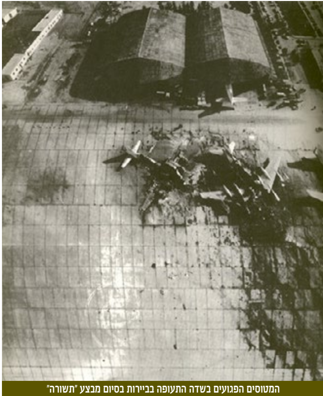
המטוסים הפגועים בשדה התעופה בבירות בסיום מבצע "תשורה"

29 בדצמבר 1969 - מבצע "תשורה" | סיירת מטכ"ל בראשות אל"מ עוזי יאירי פשטה על שדה התעופה בבירות בעקבות גל פיגועי טרור בחו"ל נגד מטוסי אל-על ויעדים ישראלים. 15 מטוסי נוסעים הושמדו. כל כוחותינו שבו בשלום.