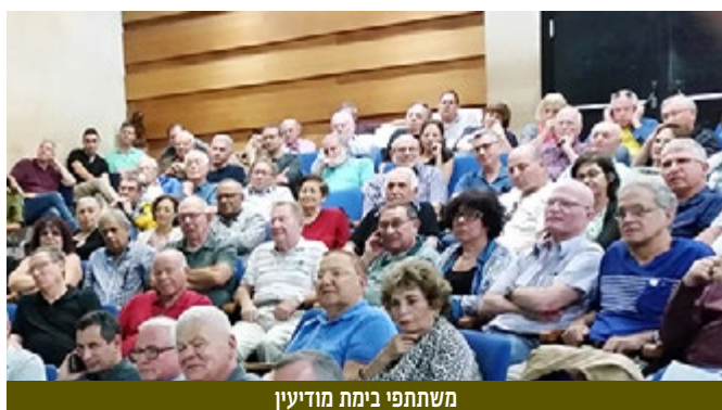
משתתפי בימת מודיעין