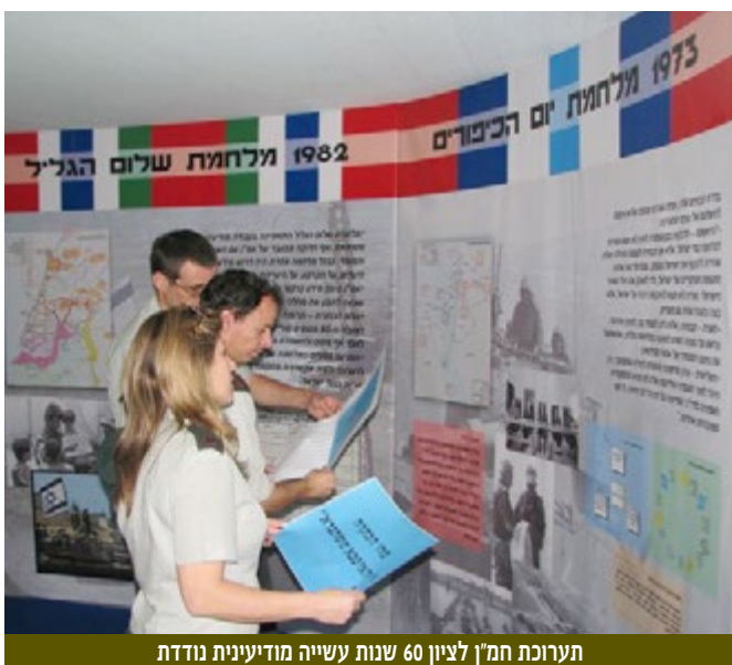
תערוכת חמ"ן לציון 60 שנות עשייה מודיעינית נודדת