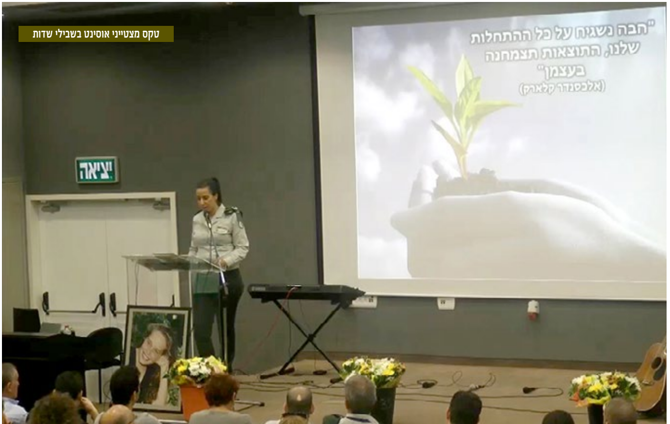
טקס מצטייני אוסינט בשבילי שדות

מערך האוסינט ביחידה 8200, אשר נותן מענה למודיעין ייחודי מרשת הציבורים, המדיה החברתית והמקורות הגלויים, נדרש למלא את משימותיו בעידן של התפוצצות מידע הזורם בשלל פלטפורמות באינטרנט, שכל אחת מהן טומנת בחובה אתגרים מורכבים בתחום מיצוי המידע וניתוחו. לא בכדי, זקוק מערך האוסינט לחיילים מוכשרים