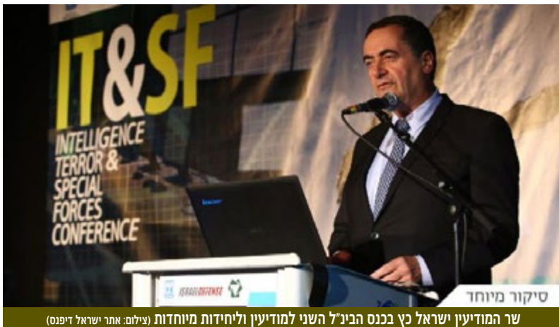
שר המודיעין ישראל כץ בכנס הבינ"ל השני למודיעין וליחידות מיוחדות

המרכז למורשת המודיעין ערך ב-19 ביולי 2016 בגני התערוכה בתל אביב, יחד עם "ישראל דיפנס", את הכנס הבינ"ל השני למודיעין, טרוור ויחידות מיוחדות. השתתפו בכנס מאות רבות של חברי העמותה ואורחים נוספים, ובכלל זה משלחות מסין ומהפיליפינים ורבים מהנספחים הצבאיים הזרים בארץ.