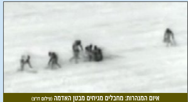
איום המנהרות: מחבלים מגיחים מבטן האדמה

הרשמה במשרדי המל"מ בטלפון 03-5491306 / 03-5497019 שלוחה 0