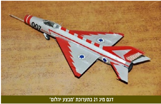
דגם מיג 21 בתערוכת "מבצע יהלום"