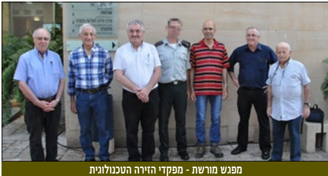
מפגש מורשת - מפקדי הזירה הטכנולוגית

לספורט ולמוסיקה. כן ציינה את הישגיו המקצועיים לאורך השנים, שהביאו להכרה בינלאומית בו כמומחה בתחום הנשק הלא קונבנציונלי, בו עסק.