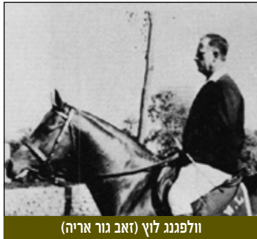
וולפגנג לוץ (זאב גור אריה)

7 במרץ 1965 - מעצרו במצרים של וולפגנג לוץ (זאב גור אריה) - "מרגל השמפניה", "האיש על הסוס" | לוץ נשלח בראשית שנות השישים למצרים ע"י היחידה המבצעית של אמ"ן (שעברה בהמשך ל"מוסד"), פעל בכיסוי איש עסקים גרמני בעל עבר נאצי, והצליח להגיע לצמרת השלטון המצרית ולספק מידע חשוב. הוא ורעייתו נחלצו מעונש מוות, נידונו למאסר עולם, ושחררו בראשית 1968, יחד עם 4 אסירי "עסק הביש".