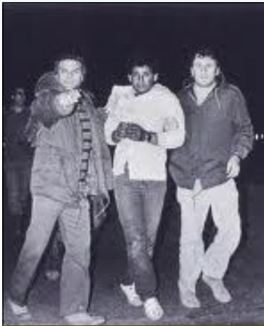
קו 300: אנשי השב"כ אוחזים באחד המחבלים

הוצאו להורג בהוראת ראש השב"כ, אברהם שלום, וכי בהנחייתו ניתנו עדויות שקר לוועדת זורע שחקרה הפרשה.