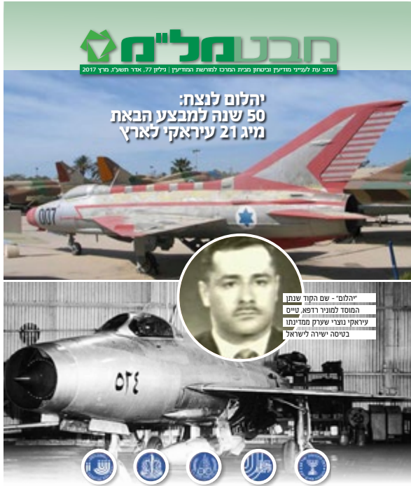
יהלום - שם הקוד שנתן המוסד למניר רפא, טייס עיראקי נוצרי שניקח ממדינתו בטיסה ישירה לישראל